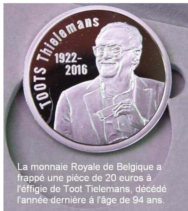
La monnaie Royale de Belgique a frappé une pièce de 20 euros à l'effigie de Toot Tielemans, décédé l'année dernière à l'âge de 94 ans.