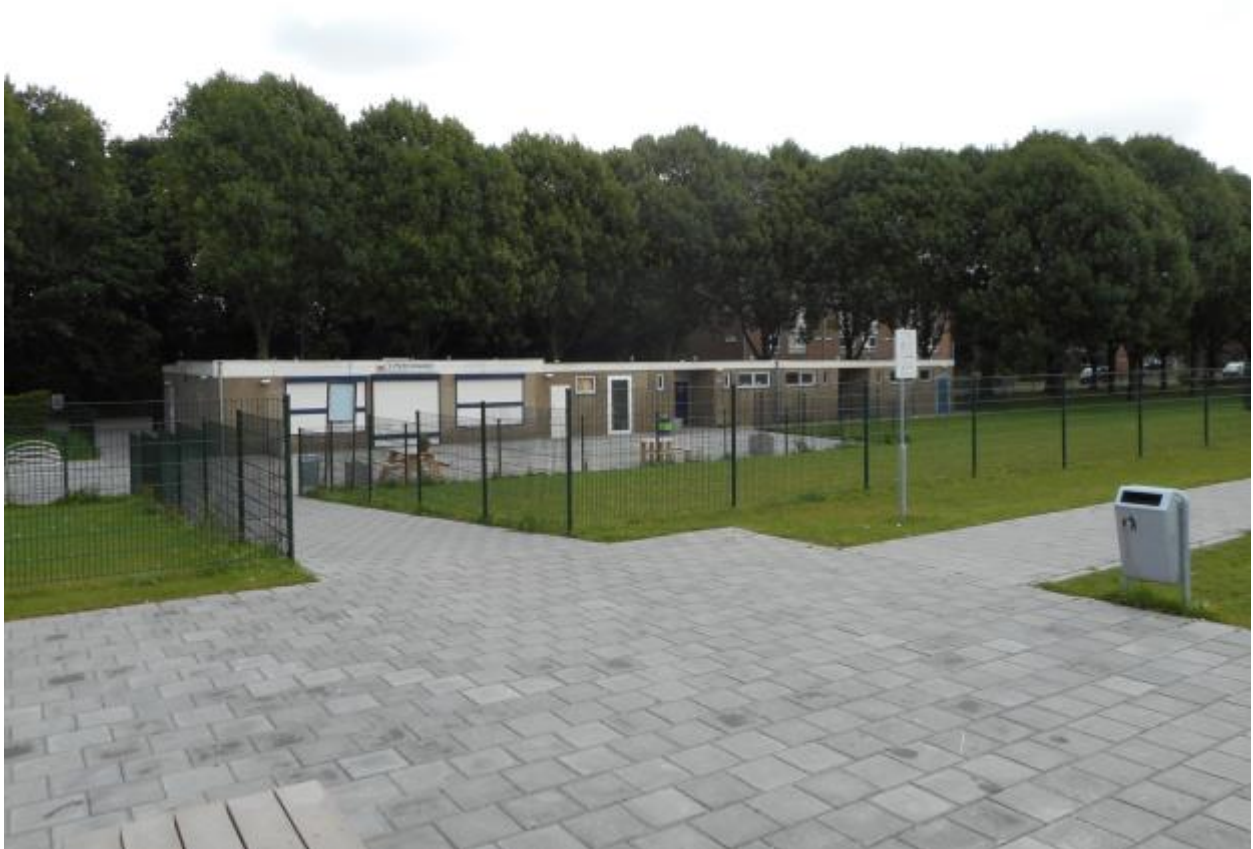
FOTO VAN HET GEBOUW GENOMEN VANUIT DE SPEELTUIN 'SJOEPIENOE'