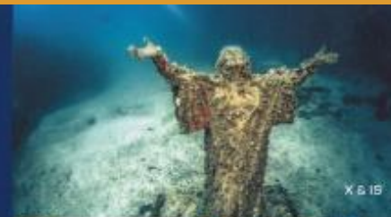
X & IS