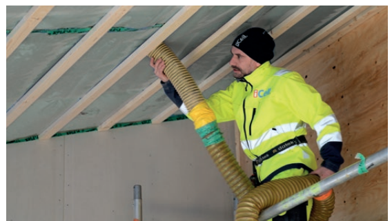
iCell Lösull med sin höga densitet i kombination med hög tröghet isolerar bättre och lufttätheten medför också en utmärkt ljudisolerande förmåga