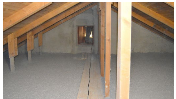
iCell Lösull ger isoleringsskikt utan skarvar och materialet kan med fördel användas i både gamla och nya konstruktioner