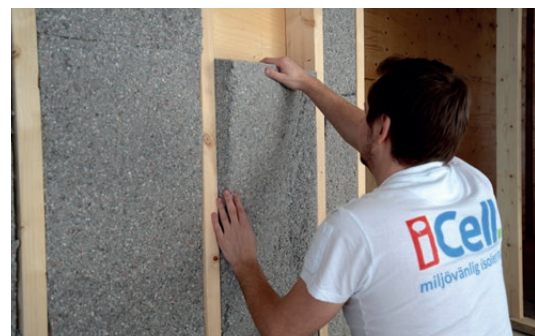
iCell Skiva är lätt att hantera, dammar minimalt och inte minst suverän ur arbetsmiljösynpunkt