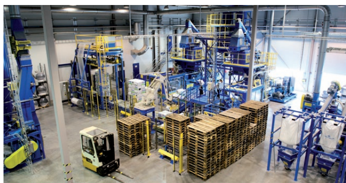
iCells fabrik på 6 000 kvm i Älvdalen är världens modernaste i sitt slag