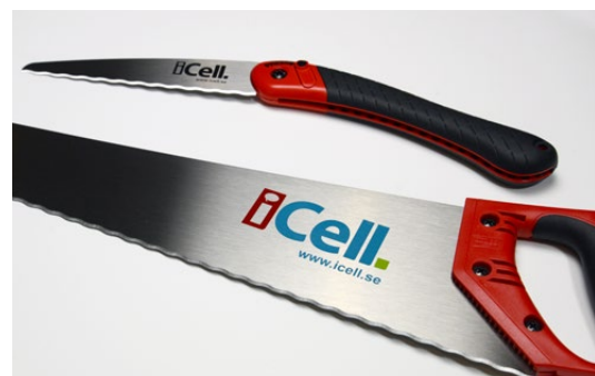
iCell Såg har utvecklats tillsammans med Bahco.