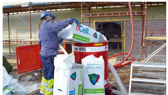
iCell Lösull sparar material då inget spill förekommer, endast exakt mängd material för varje konstruktion installeras, resterna av isoleringen tas om hand och kan användas i nästa byggprojekt.