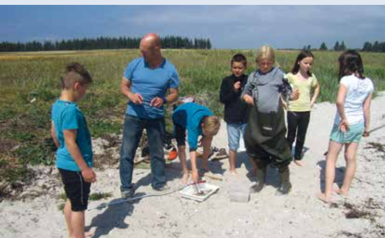
Fra 3. klasses tur på Bågø.