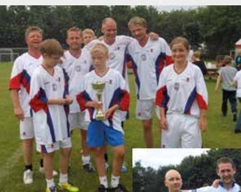
Bestyrelsen i Boldklubben blev nr. 2.