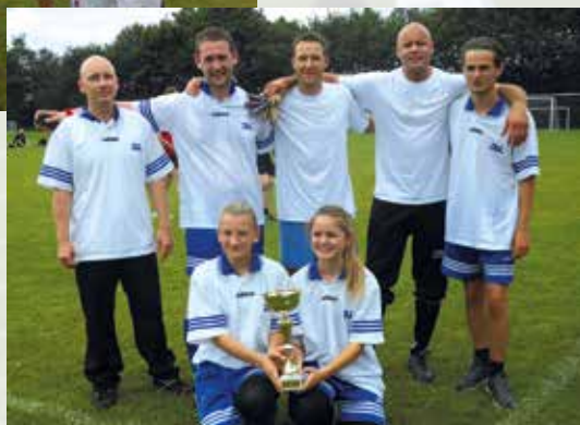
3L - vinder af sponsorfodbold

Så kom uge 24 igen, hvor Brylle Boldklub afholder den årlige sommerfest, og alle går og holder øje med vejret. Skal vi have regn som det har været de sidste par år, eller kan vi være heldige at få tørvejr.