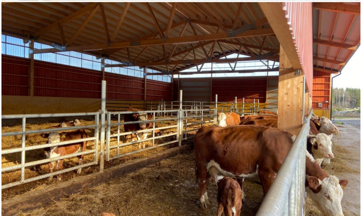
Inspiration- stall med öppen långsida