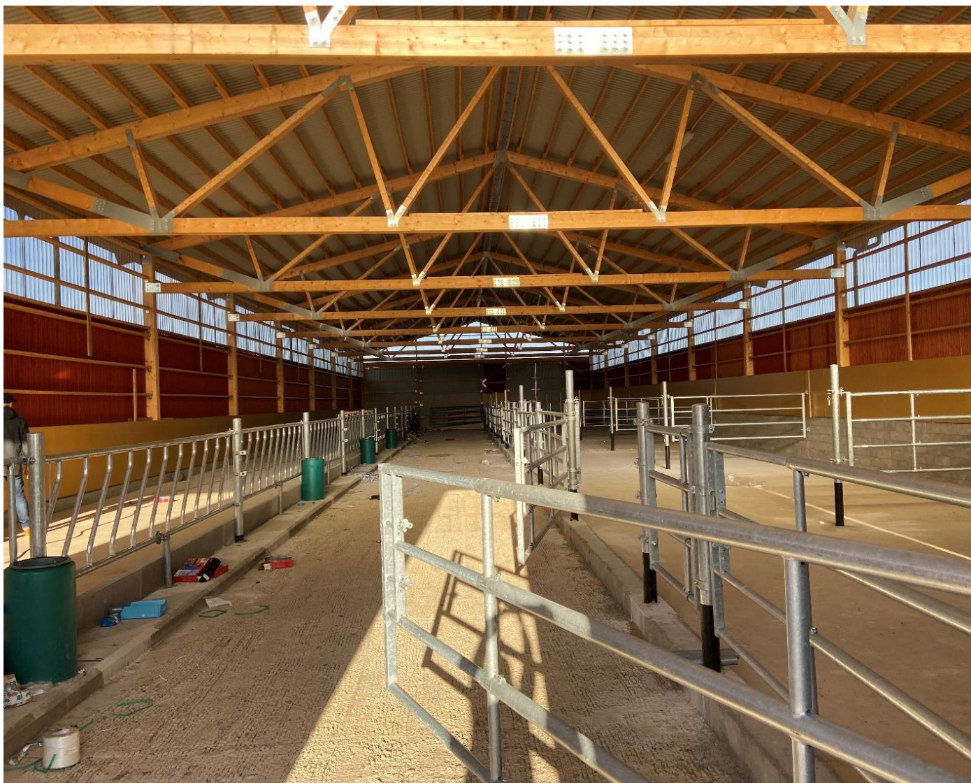
Inspiration - Stall med inbyggda långsidor