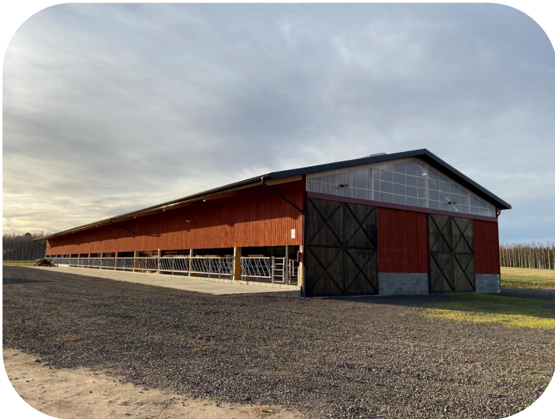
Exempel ljusinsläpp i gavel