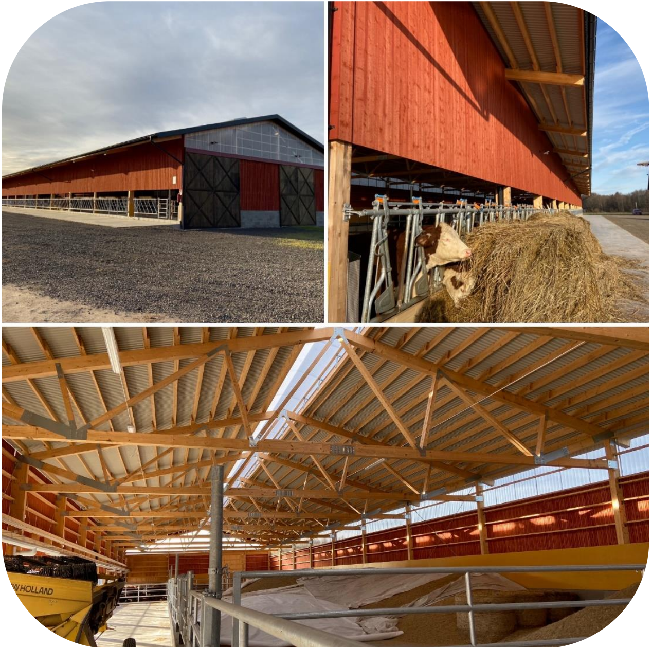
Exempel ventilerad nock med ljusinsläpp. Den perforerade plåten i bakvägg syns väl på detta foto.