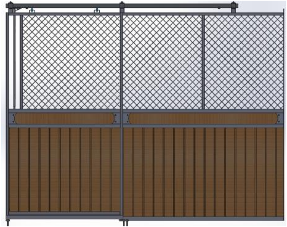
Galvad med granplank och dekorationsbräda. Skjuddörr

Ruter Knekt är en designad modell av Trygga med stående ruter, säkerhetstestat nät med simulerad hästspark, skjuddörr med massor av möjligheter; dekorationsbräda, ljusinsläpp i fronten, V formad lucka i dörren som kan hakas av, vippkrubba, ek och plastplank, svartlack. Läs mer på http://www.bruksbalken.se/haststall/stallinredningar/