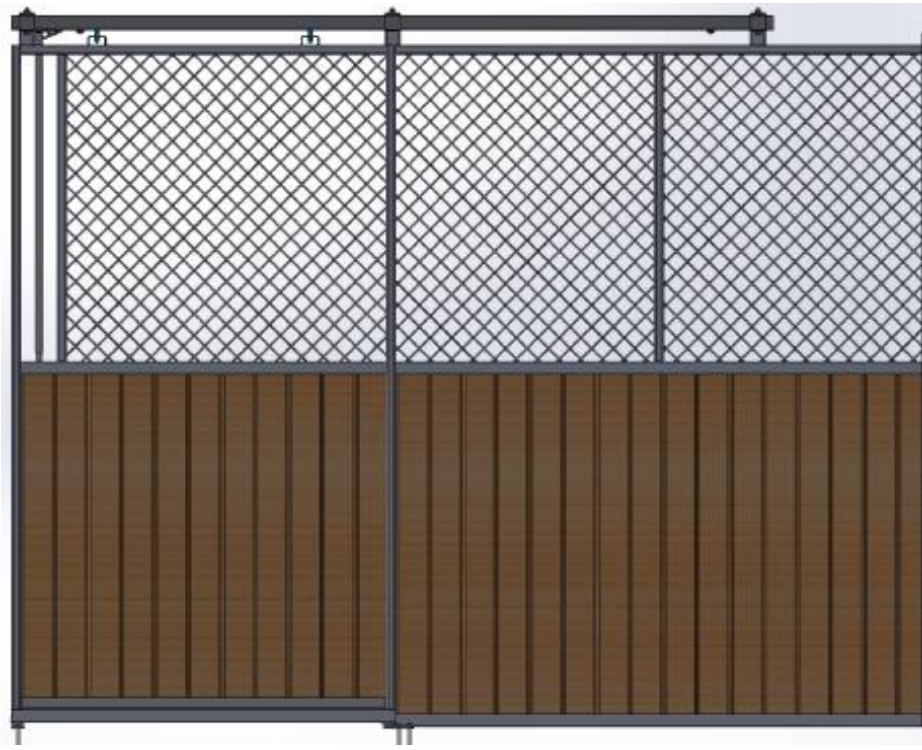
Basmodell - Galvad med granplank. Skjuddörr. Tillval skjutlucka i fasta fronten – precis som Trygga.