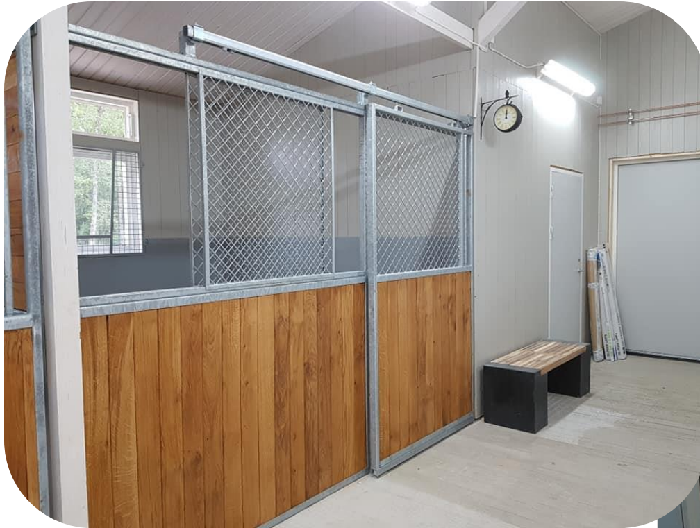
Modell bas med skjutlucka i fasta fronten. Ekplank.