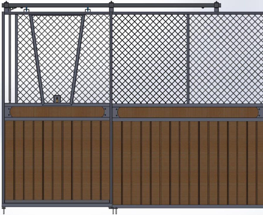
Ruter Knekt - Galvad med granplank och dekorationsbräda samt öppningsbar lucka i fronten som kan hakas av.