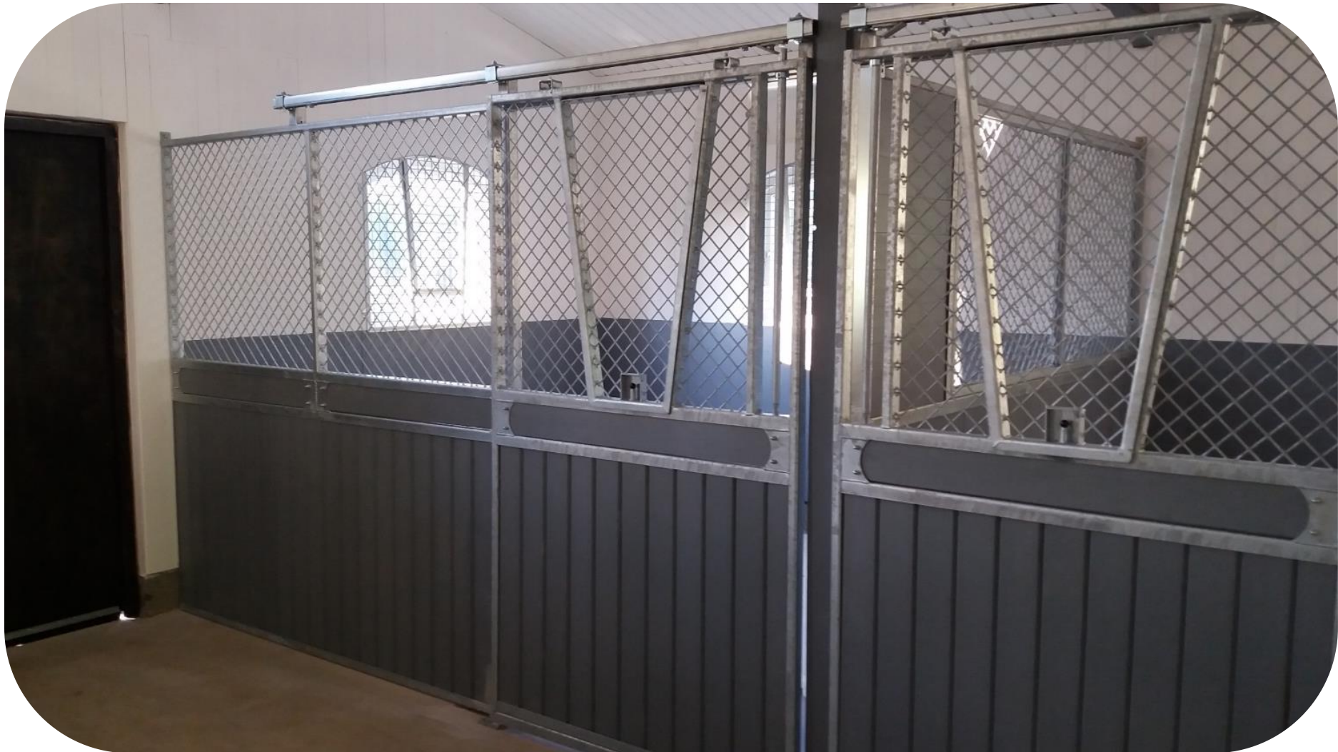
Galvad, granplank, V formad avtagbar lucka, dekorationsbräda

Ruter Knekt är en designad modell av Trygga med stående ruter, säkerhetstestat nät med simulerad hästspark, skjutdörr med massor av möjligheter; dekorationsbräda, ljusinsläpp i fronten, V formad lucka i dörren som kan hakas av, vippkrubba, ek och plastplank, svartlack. Läs mer på http://www.bruksbalken.se/haststall/stallinredningar/