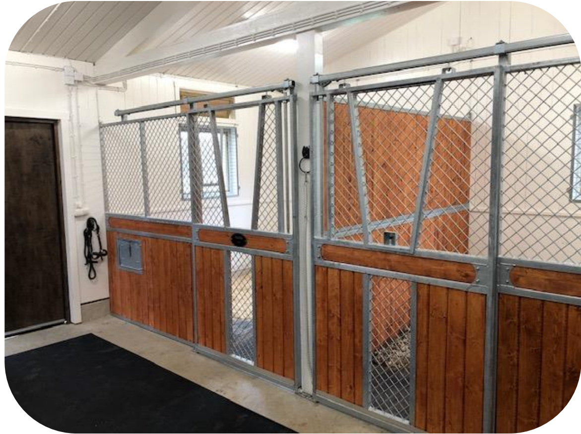
Avtagbar V formad lucka, dekorationsbräda, granplank, vippkrubba, ljusinsläpp i front

Ruter Knekt är en designad modell av Trygga med stående ruter, säkerhetstestat nät med simulerad hästspark, skjutdörr med massor av möjligheter; dekorationsbräda, ljusinsläpp i fronten, V formad lucka i dörren som kan hakas av, vippkrubba, ek och plastplank, svartlack. Läs mer på http://www.bruksbalken.se/haststall/stallinredningar/