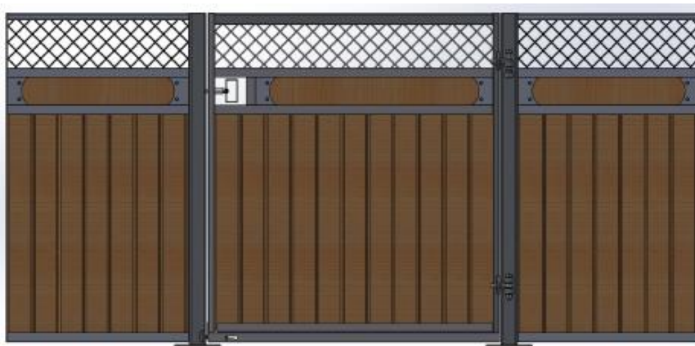
Galvad med granplank, dekorationsbräda