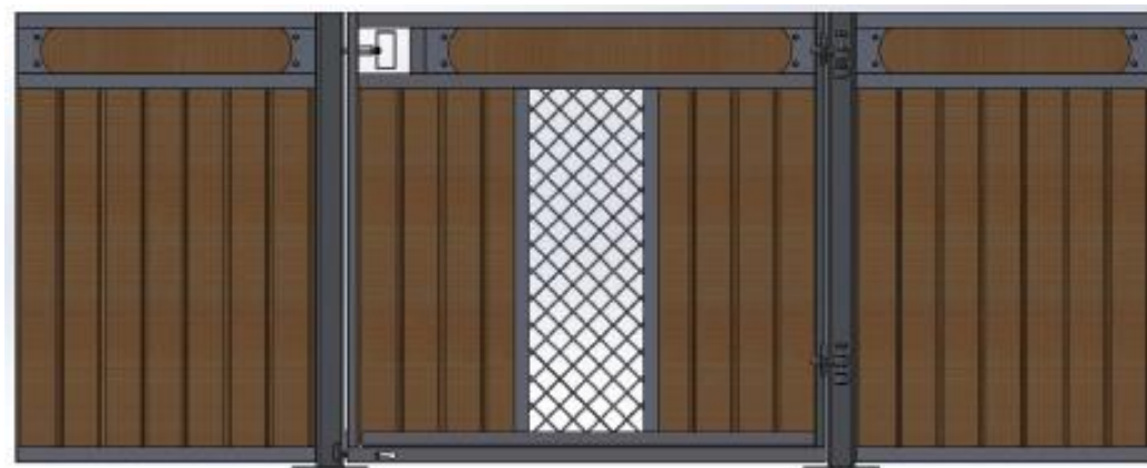
Galvad med granplank, dekorationsbräda, ljusinsläpp i front. Ponnymodell.

Ruter Dam med är en låg modell med slagdörr, 120 cm alt 145 cm hög, som matchar i första hand Ruter Kung men kan även bli snygg tillsammans med Ruter Knekt. Rutnät, säkerhetstestad med simulerad hästspark, helt utan nät, slagdörr, massor av möjligheter; dekorationsbräda, ljusinsläpp i fronten, ponnymodell, ek och plastplank, svartlack.