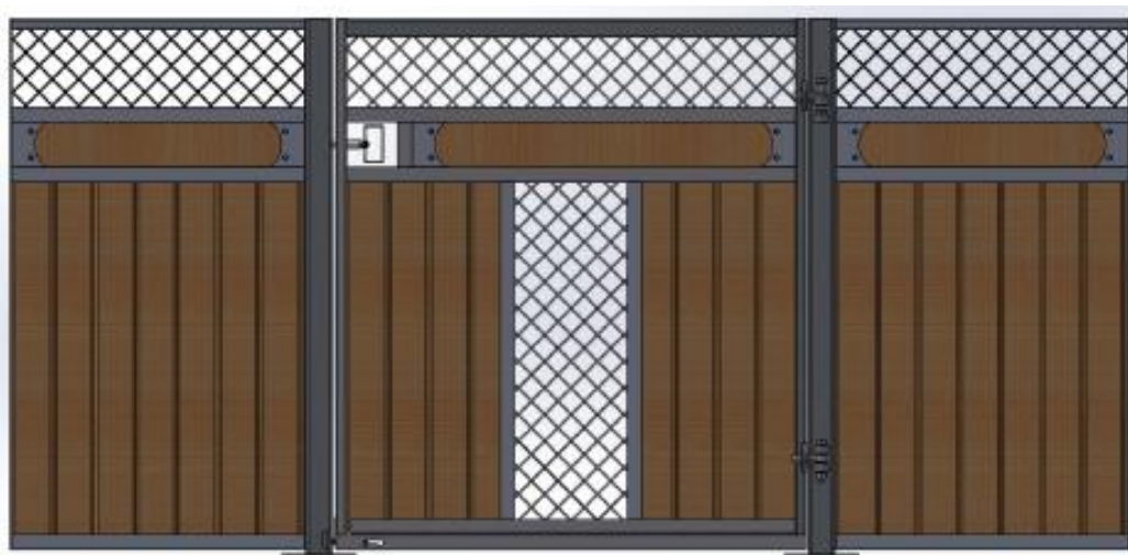
Galvad med granplank, dekorationsbräda, ljusinsläpp i front.