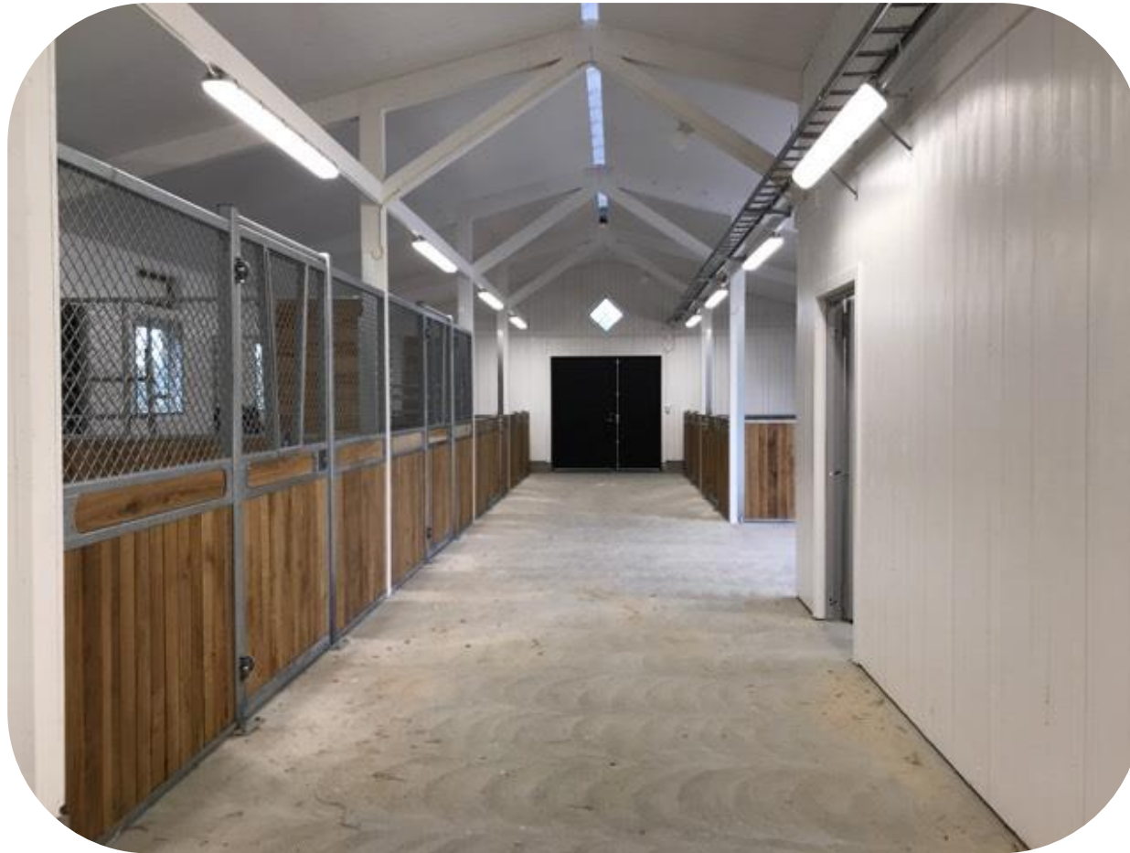
Bruksbalkens stall med 3 meter bred stallgång. 4 boxar Ruter dam och 2 boxar Ruter Kung med avtagbar lucka i fronten. Ekplank och dekorationsbräda

Ruter Dam med är en låg modell med slagdörr, 120 cm alt 145 cm hög, som matchar i första hand Ruter Kung men kan även bli snygg tillsammans med Ruter Knekt. Rutnät, säkerhetstestad med simulerad hästspark, helt utan nät, slagdörr, massor av möjligheter; dekorationsbräda, ljusinsläpp i fronten, ponnymodell, ek och plastplank, svartlack.