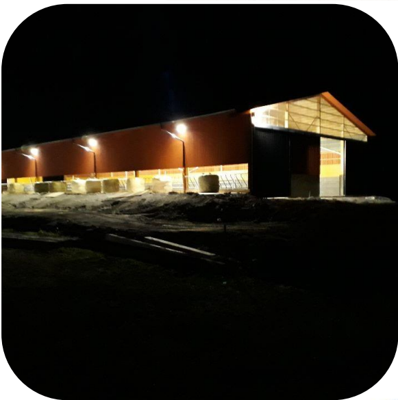
Exempel: ljusinsläpp i gavel