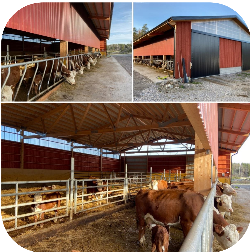
Skrapgång inkl. klövpall har som standardbredd 4 meter

Fler bilder och inspiration; https://www.facebook.com/BruksbalkenVarnamo/ / www.bruksbalken.se