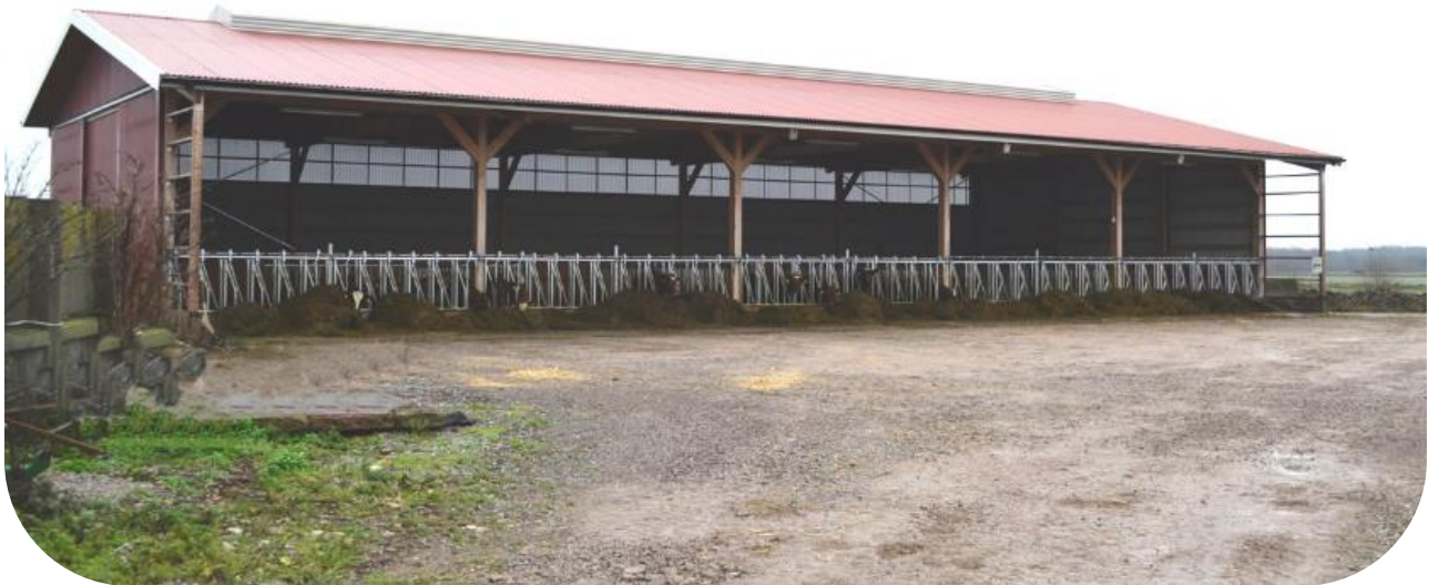
Exempel: ventilerad nock med ljusinsläpp. Den perforerade plåten i bakvägg syns väl på detta foto