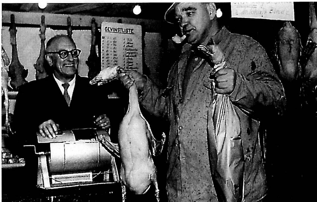
En glad sælger, en glad Vinder