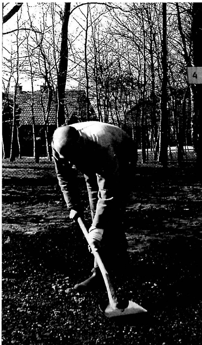
Grunden til bane 4 lægges.

Jeg husker også, at vi i krigens tid, hvor vi ikke kunne få tennisbolde, sendte vore bolde med rejsebud til Aalborg for at få dem pumpet op.