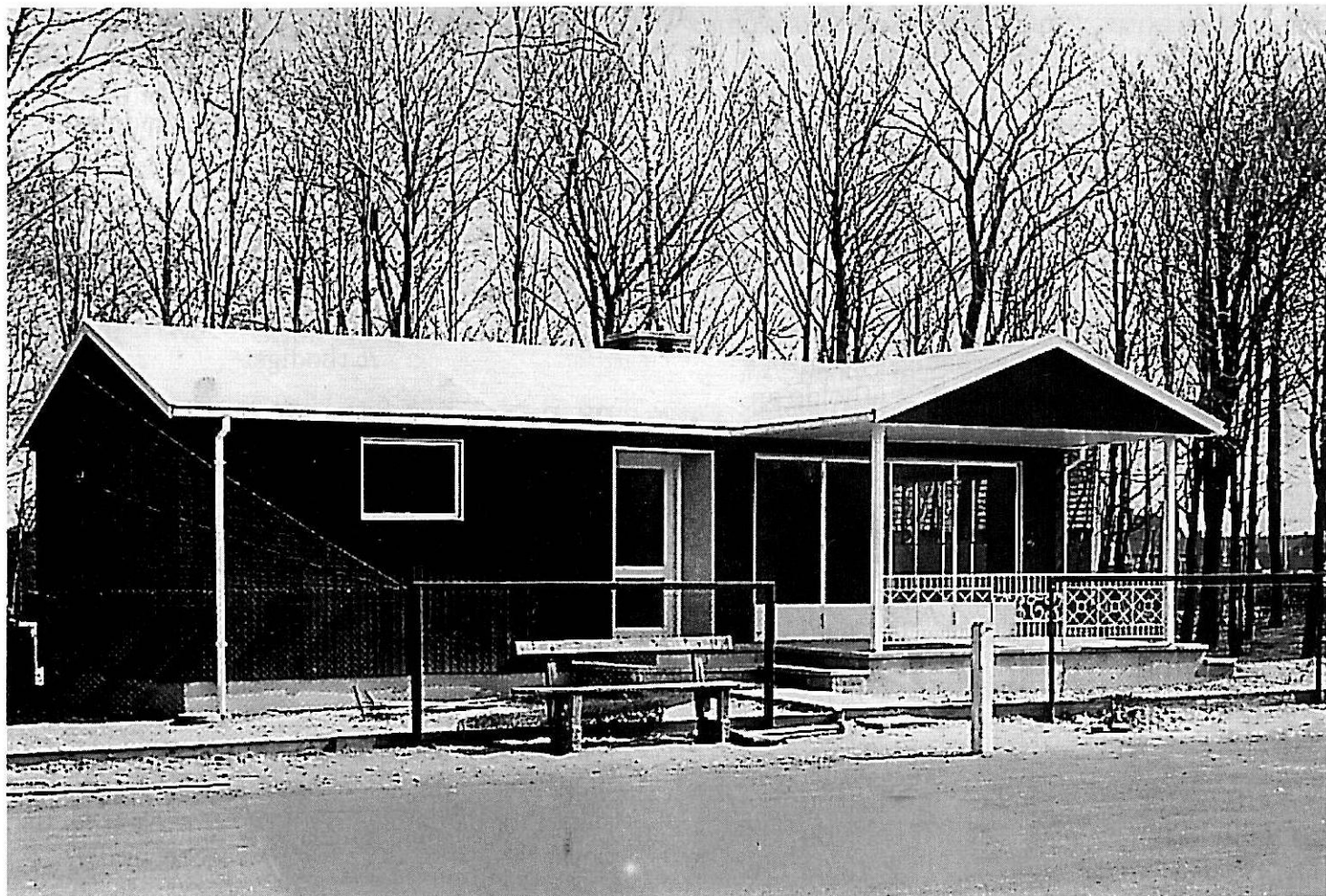
Klubhuset færdigbygget Maj 1949

Der blev også afholdt fest i forbindelse med ibrugtagningen af klubhuset - nedenfor ses invitationen til festen: