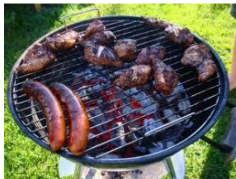
Grilla, men visa gärna hänsyn

Det är inte förbjudit att grilla på balkonger och terrasser, men visa gärna hänsyn för era grannar och miljön. Undvik tändvätska. Använd miljövänlig grilltändare exempelvis elektrisk grilltändare som ger en glödande kolbädd på 15 minuter.