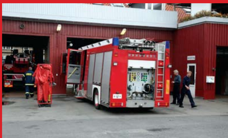
Tomsgårdens brandstation har overtaget kemidyknin-gen efter pionertjenesten og er i gang med at blive uddannet. Her er de lige kommet hjem fra dagens øvelse.