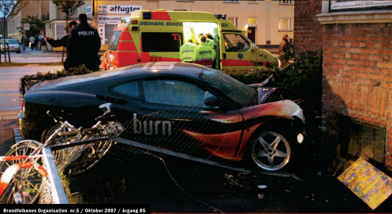
Brandfolkernes Organisation nr.5 / Oktober 2007 / årgang 85