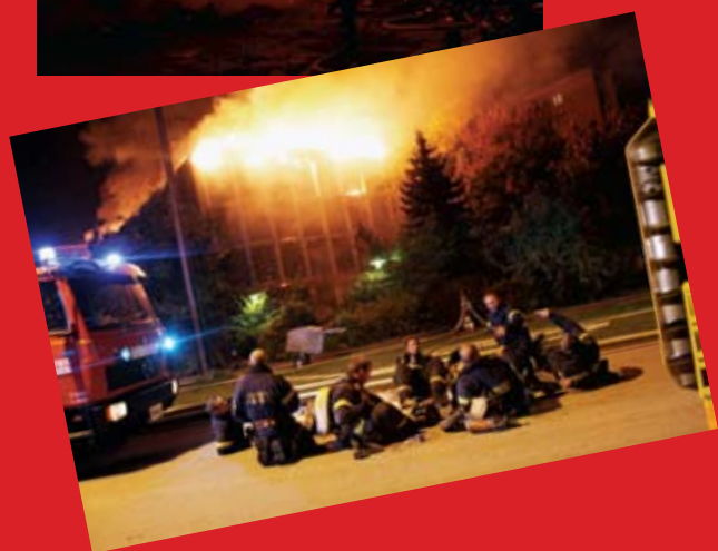
En kraftig brand på det nyrenoverede plejehjem Dronning Ingrid Plejehjem udviklede sig voldsomt. Beboerne var heldigvis ikke flyttet ind endnu.