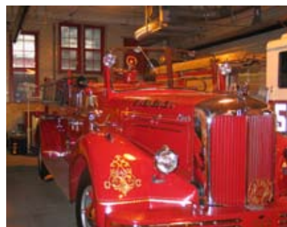
Denne gamle Engine 343 bliver i dag brugt som rustvogn for omkomne brandfolk.

begravelser. Det er jo ikke nogen hemmelighed, at der i Amerika dør mange brandfolk i tjenesten. Det fik vi at se. Der var lige omkommet 2 brandfolk i Bronx i slutningen af august, og mens vi var der, omkom en brandmand i Jersey City lige på den anden side af Hudson River i en villabrand.