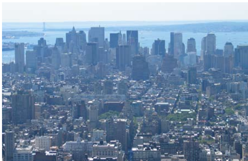
Et kik ud over Manhattan