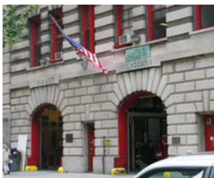
Brandstationen i Duane St. 100 Engine 7 og Ladder 1

til 1 mand, Stg (tower ladder 1), som nærmest er en lift/snorkel, som der er 6 mand på, samt et køretøj, som battalion chief kører med (på dansk: indsatsleder); der er en chauffør foruden indsatslederen. Stationen har også en hjemmeside, som er www.state.lyduanemanor.com .