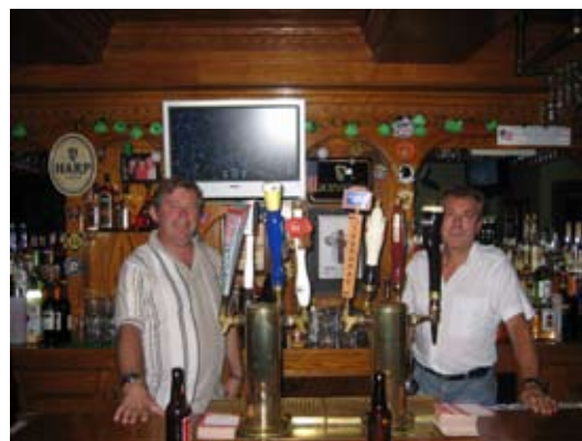
To Danske brandmænd i rette »element« på O`hara.