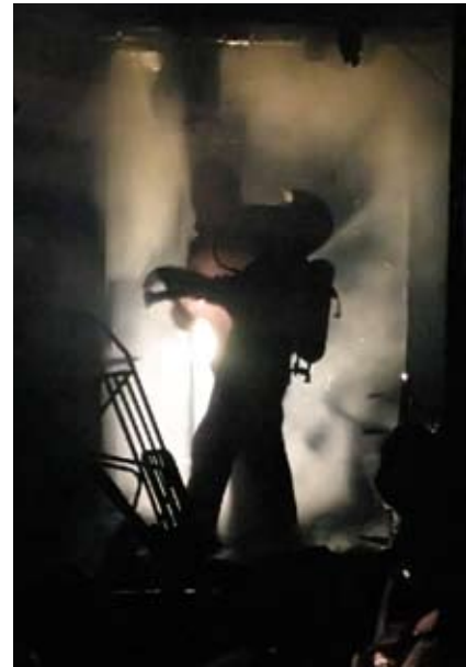
En rigtig god indsats af »drene« fra Vestegnen