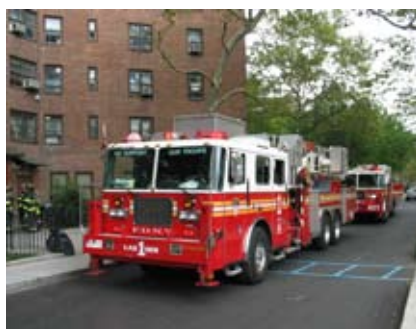
Engine 7 og Ladder 1 på tur. Ild i container i baggård.

på skuldrene. Vi vandt. Det lød spændende for dem. Da snakken kom på stiger, så var deres rent faktisk en snorkel eller lift uden knæk på 100 ft., og der var pumpe på, men ingen slanger, det havde sprøjten jo! Så fik vi den. Kompositflasker havde de alle sammen, og det har de haft en del år. Så sagde vi, at det fik vi også, men vi havde ingen dato.