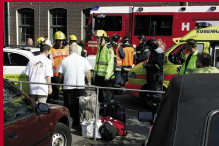
Færdselsuheld med taxa