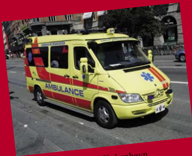
Ny ambulance i København