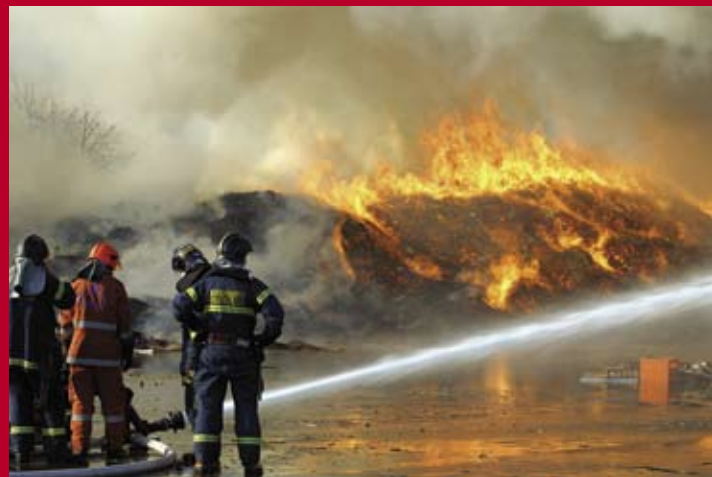
Branden på Selinavej