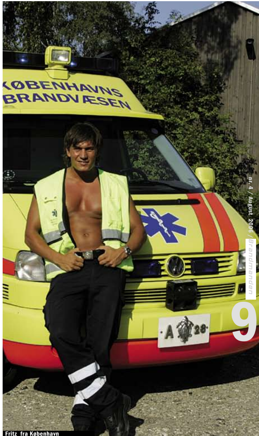
Fritz fra København