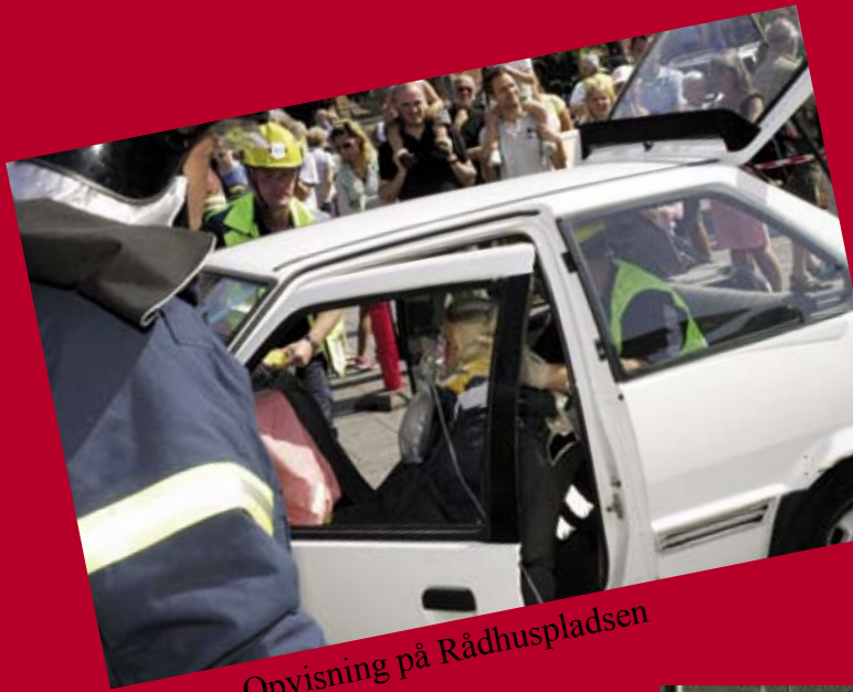
Opvisning på Rådhuspladsen