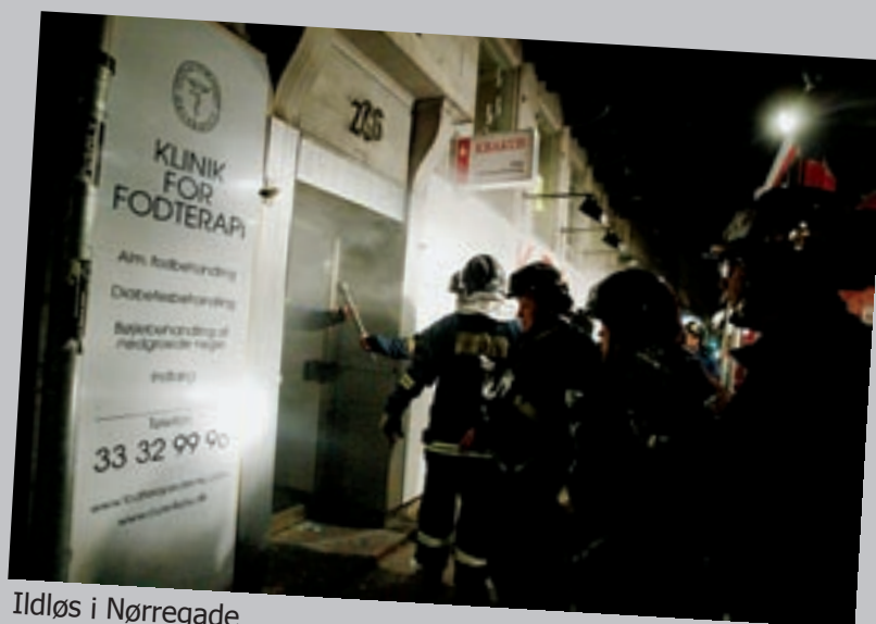
Ildløs i Nørregade