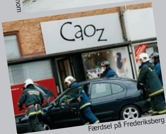
Færdsel på Frederiksberg