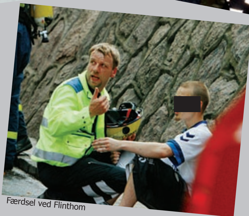
Færdsel ved Flintholm