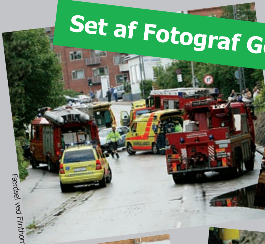
Færdsel ved Flintholm