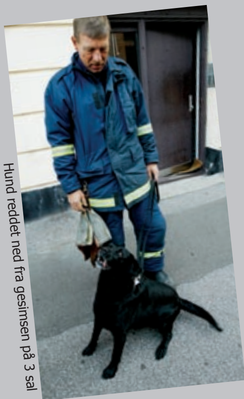
Hund reddet ned fra gesimsen på 3 sal