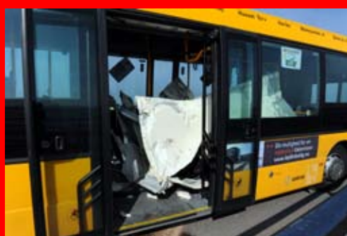
Heldigvis var der ingen passagerer i bussen, da den, den 8. april blev påkørt bagfra af en lastbil.