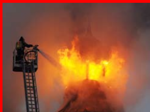
Tagbranden fra Prags Boulevard på vej ned af trappen og i tårnet.