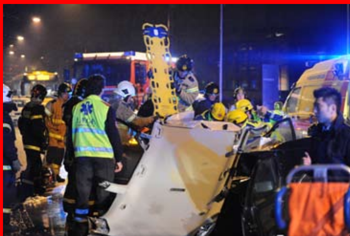
Tre fastklemte ved et færdselsuheld på Lygten den 8. april