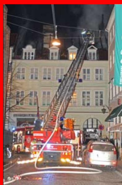
Efter sigende var det en cigaret i en tør altankasse, der bredte sig til taget i Valkendorfsgade den 24. april.