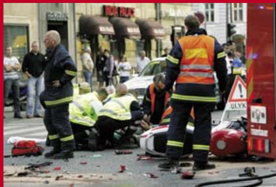
MC ulykke Vester Voldgade - Studiestræde.