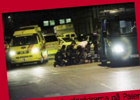
Anholdelse vedr. skuddrama på Palermo