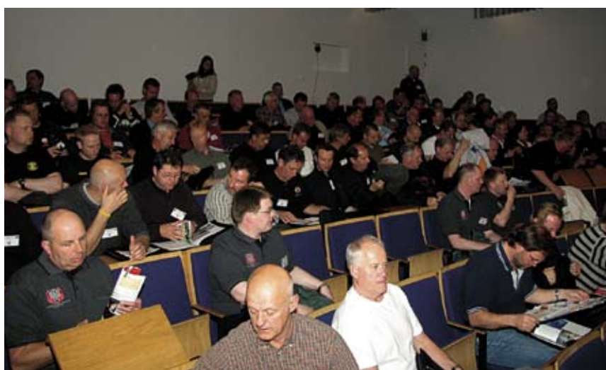
Nordiske brandmænd tli fælles foredrag

Torsdag blev en lang dag, nok fordi flere havde studeret Reykjavik om aftenen, men også fordi dagens emner var præsentation af love og direktiver, bemanning, uddannelse, karriere og valgmuligheder, samt værnemidler. Dagens vel nok bedste fremlæggelse kom fra Island, som havde taget en del humoristiske indslag med. Men nok så alvorligt stillede spørgsmålet; om vi har nået grænsen for, hvor langt vi skal gå, inden vores egen sikkerhed er sat over styr. Sidste opgave for Island var at overlevere fanen til Stockholm, som skal være vært i år 2007, der også er 70 årsdag for NBS. Aftenen bød på banket, hvor hele 5 personer blev udnævnt til Æresmedlemmer. Alt i alt nogle ganske interessante dage på en meget kold ø i nord atlanten.