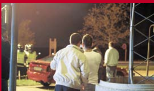
Uartig fotografering med mobiltelefon. Skal vi finde os i det???