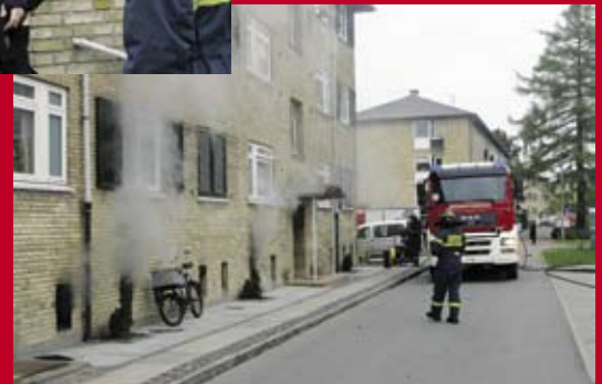
Kælderbrand i Vinhaven