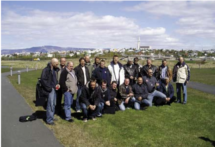
Den danske delegation