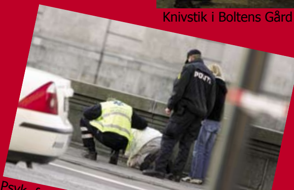
Psyk. førstehjælp til bekendt af ofret