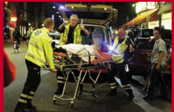
Knivstik i Boltens Gård -igen...