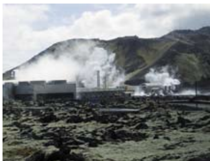
Dampkraftværk i Island

et havari af en dansk helikopter fra søværnet, da deres skib lå i havnen. Helikopter assistance virker ca. 200-250 dage om året grundet meget eftersyn og vejrlig.