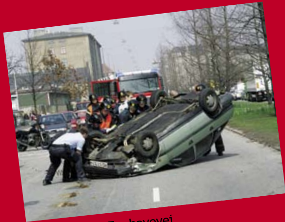
Bil på taget, Enghavevej