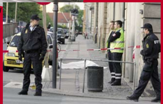
Bestialsk knivoverfald ved stormgade begået af psykisk syg.