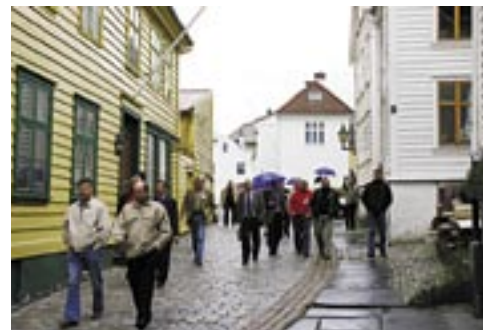
Foto: På rundtur i Bergen

delegationer kunne. Men lad det ikke være en hemmelighed, at det primært var Göteborg og København, der lagde stemningen an, så der nærmest opstod konkurrence.