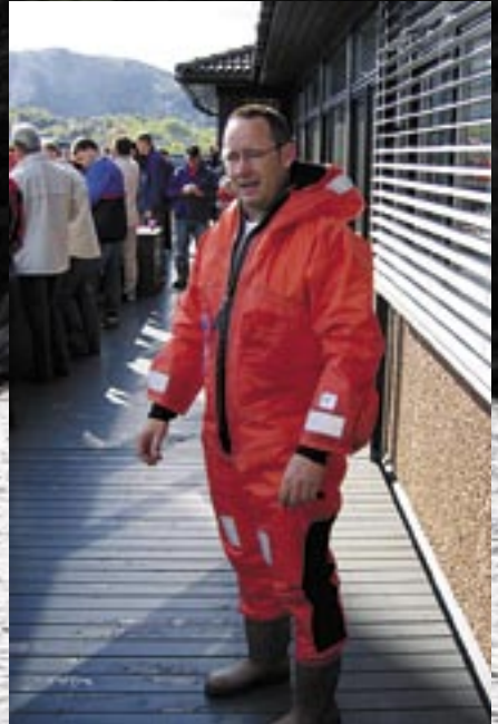
Foto: Besøg på Nutec