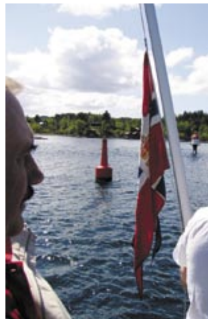
Foto: Flaget på halvt ved ulykkesstedet

Da redningsmandskabet nåede frem til det sted, hvor skibet befandt sig, var der det problem, at skibet var begyndt at flyde med strømmen med en hastighed af ca. 4 knob. Derfor var man nødt til at få skibet bragt til standsning op ad en klippe side og fastholdt ved hjælp af to bugserbåde og et andet større fragtskib, der ganske enkelt pressede skibet ind mod klippesiden.