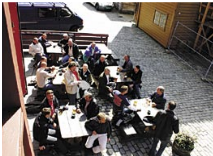
Foto: Eftermiddag på Bryggen

I næste nummer af Brandmanden kan Du læse om ambulancetjenesten i Bergen