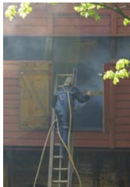
Fotos: Historisk opvisning i brandslukning