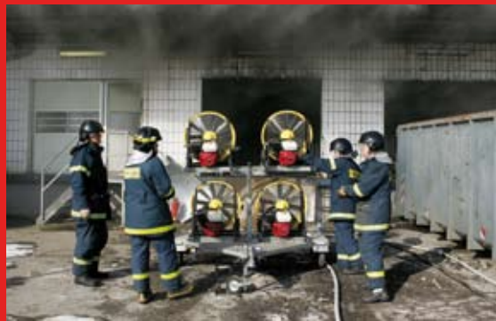
Ventilatorer i brug ved silobrand