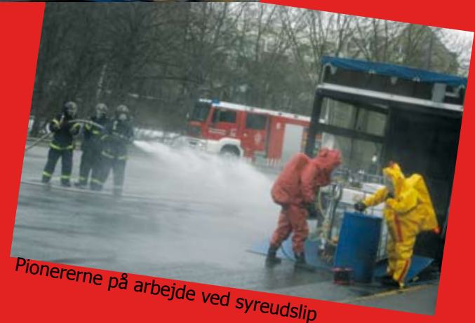
Pionererne på arbejde ved syreudslip