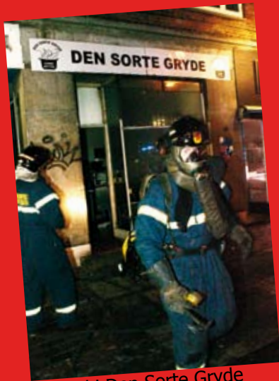
Brand i Den Sorte Gryde