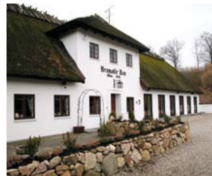
Billede af Bromølle Kro

Det er naturligvis muligt selv at sørge for transporten. Programmet for udflugten og girokort udsendes den 19. april 2006.