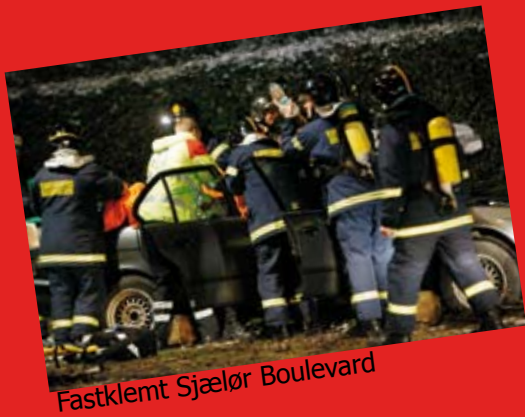
Fastklemt Sjælør Boulevard