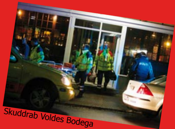
Skuddrab Voldes Bodega