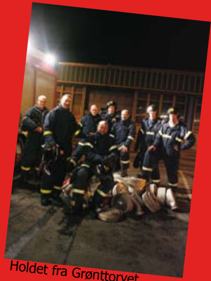
Holdet fra Grønttorvet