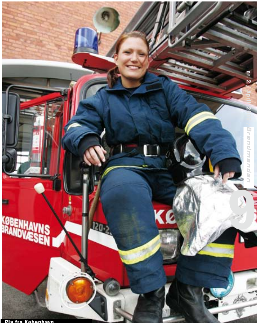
Pia fra København