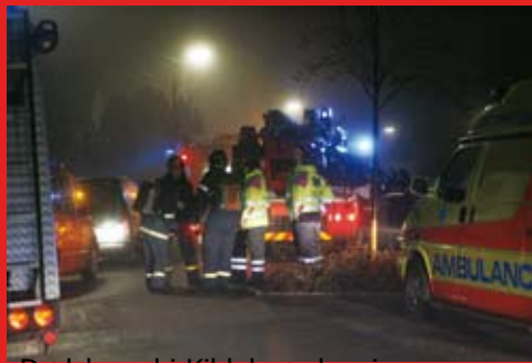
Dødsbrand i Kildebrøndevej