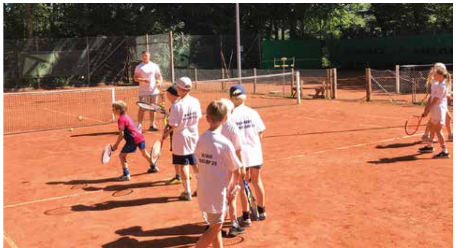
Masser af forsøg skal der til, inden de unge tennisspillere får fornemmelsen af, at de rammer bolden helt rigtigt.

De to trænere lægger ikke skjul på, at det solrige sommervejr gør oplevelsen endnu større. Tidligere år har regnen spillet med og gjort det nødvendigt at ændre planer. Men i år er vejret præcis, som tennisspillere kan ønske sig.