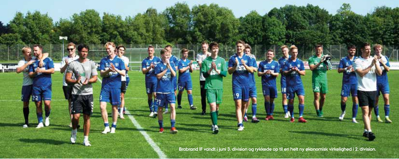
Brabrand IF vandt i juni 3. division og rykkede op til en helt ny økonomisk virkelighed i 2. division.