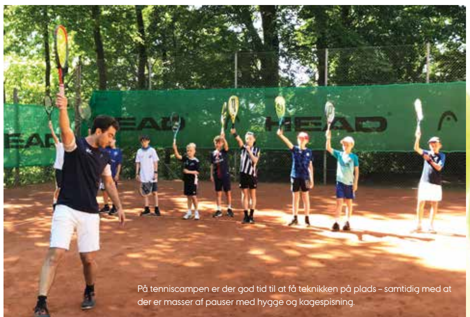
På tenniscampen er der god tid til at få teknikken på plads – samtidig med at der er masser af pauser med hygge og kagespisning.