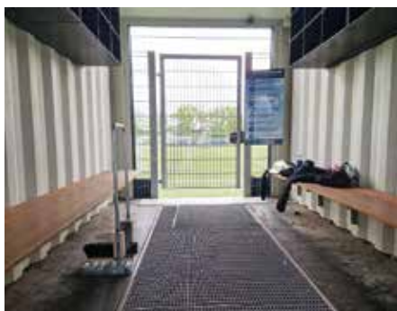
De nye tiltag er nu på plads, og det er nu op til spillere, trænere og gæster selv at rengøre tøj og sko for gummigranulat, så de små gummistykker ikke tages med hjem i vaskemaskinen og ender ude i vandmiljøet.

“Vi havde et møde med konsulent og kommunen i slutningen af 2024. Vores bandede er 40 cm høje, mens vejledningen anbefaler 50 cm. Så det blev diskuteret, om bandede skulle pilles ned og erstattes af en presenning der i bunden lægges ind under græsset. Men det er efter vores vurdering meningsløst at forsøge at redde nogle få granulat-korn, ved at smide en masse plastik plader ud og indkøbe store mængder presenning.”