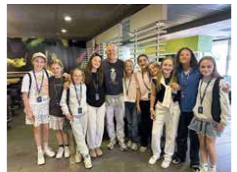
Undervejs fik nogle af Brabrand-spillerne en selfie med landstræner for håndboldherrene, Nikolaj Jacobsen.

På billederne ser du glade Brabrand-spillere på banen, til åbningsceremoni og til selfie med landstræneren.