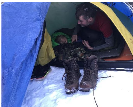
Spejderleder - Friluftsmenneske, sover i telt hele året, også i Norge om vinteren i sne...