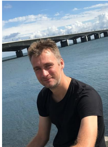
Er Bygge Anlægsingeniør

Bader normalt altid i Påsken. Vandre gerne - Kyst til Kyst sommer 2020 med min datter (Vejle til Blåvand) – Har tidligere været vandreguide på Grønland. I 2020 fik vi hvalp – Bella 🐾