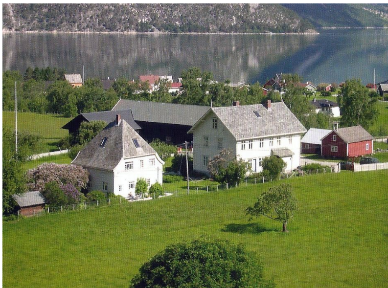
(Gården Natvik i Vikadalen.)