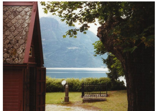
(Lusterfjorden set fra Dale kirke)

Der hvor Europas længste fjord, Sognefjorden, strækker sig ind over landet i mødet med Jostedalbreen og Jotunheimen, ligger Luster kommune. Luster, som er mellem de største kommuner i Syd-Norge, er en fascinerende del af Norge. Et vestland i miniature med smukke fjorde, bratte fjelde, vandrige fossefald, blå breer og frodige dale. De omkring 5000 indbyggere i kommunen har landbrug, frugt- og bær dyrkning, industri, elkraftproduktion, rejse- liv og privat og offentlig service som levevej.