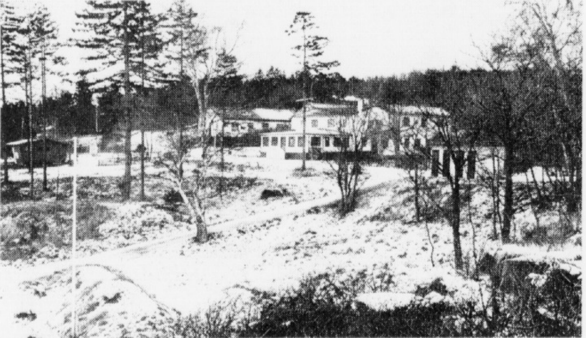
Hotel Sandkaas set fra grunden ved stranden

Sådan ser det nye hotel ud i arkitekternes model. De mærkelige terrasser foran huset markerer blot grundens skrånning mod vejen. I virkeligheden var det blevet til et grønt haveanlæg. Det får man indtryk af på skitsen nederst på siden. Her kan man bedre se, hvordan hotellet så nogenlunde ville være kommet til at tage sig ud, et par år efter opførelsen. Hvor grunden er plantet til - og det grønne har fået lov til at brede sig frodigt, også ud over bygningens altaner. Det nye hotel ville komme til at fylde mere i landskabet end det gamle, det er klart. For der kunne bo 6-8 gange så mange gæster, i små lejligheder med opholdsrum, særskilt soveafdeling og køkken, badeværelse og garderober. Og der ville være stort, fælles svømmebassin, sauna - og bar og restaurant med offentlig adgang. Et moderne hotelbyggeri, javel. Men ville det passe dårligere i landskabet end det gamle pensionat?