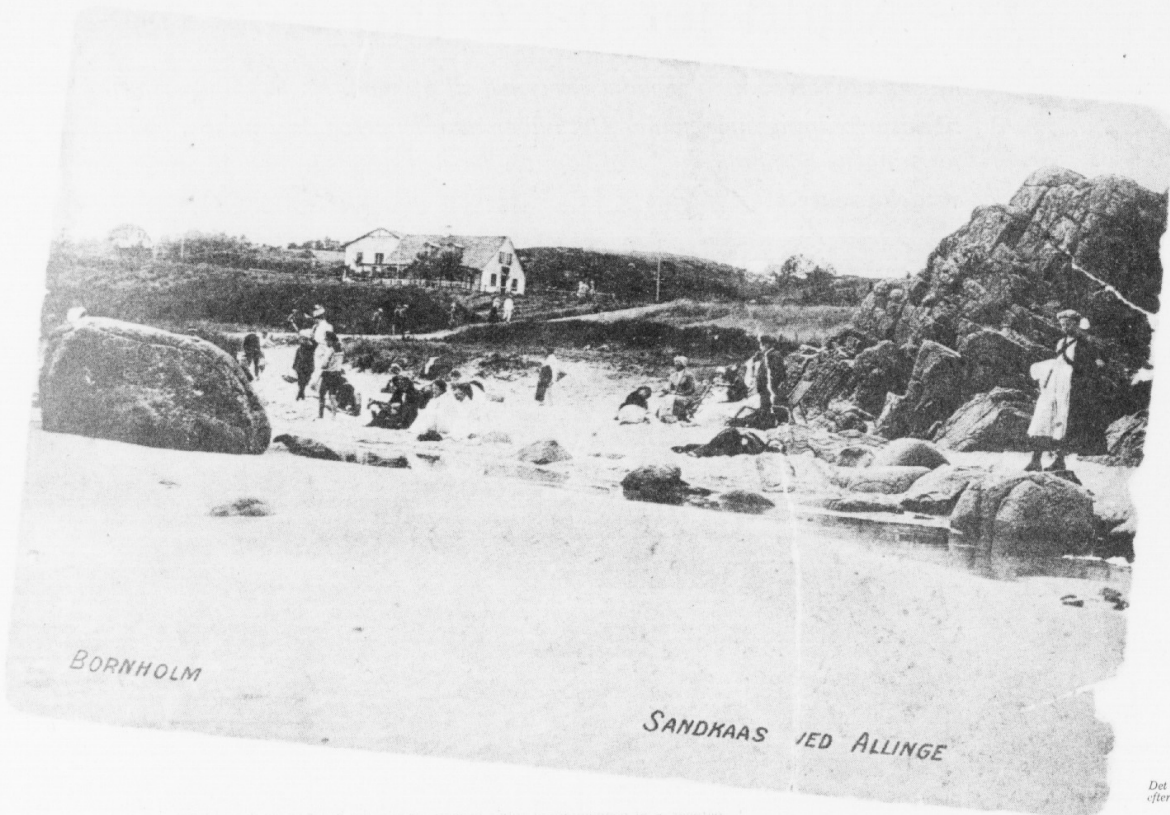
Det oprindelige Hotel Sandkaas, efter postkort fra omkring 1910