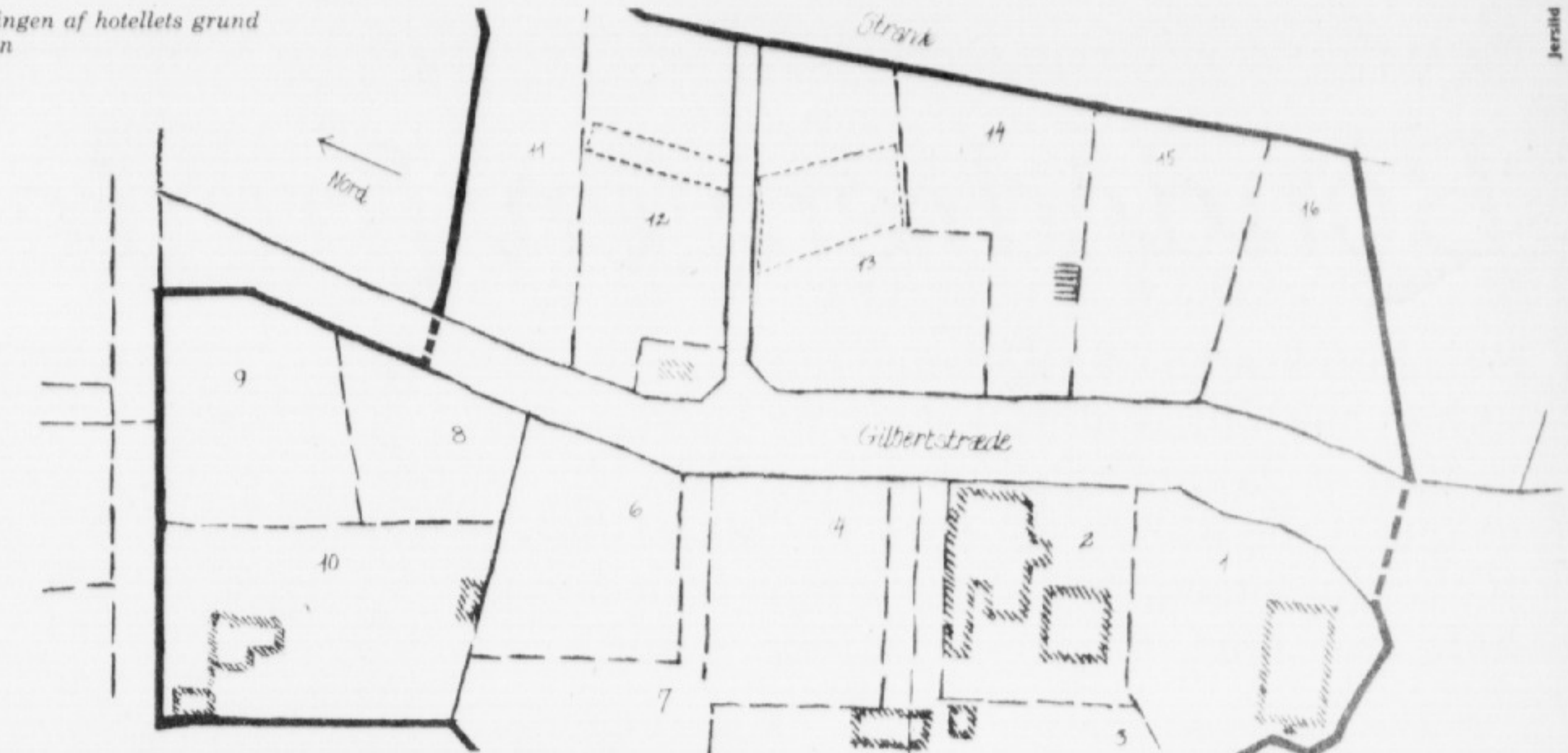
Plan over udstykningen af hotellets grund og naboejendommen