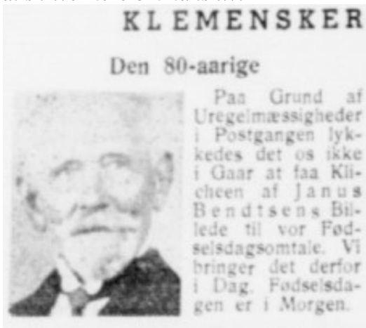
19. februar 1947 Bornholms Tidende