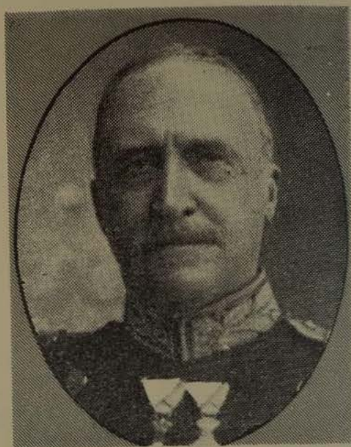
Amtmand, Baron Bille Brahe Repræsentantskabets første Formand

I Amsraadsmødet 28. Sept. forelaa Andragende fra Fysikus Hansen paa Udvalgets Vegne om et Tilskud fra Amtet paa Halvdelen af Udgifterne til Opførelse af et Tuberkulosesygehus paa 20 Senge (siden udvidet med 6 Senge) med en dertil knyttet Sanatorieafdeling paa 10 Senge. Anstalten antoges at ville koste ca. 60,000 Kr., og Byggegrunden ventedes overladt af Staten uden Véderlag. Til Sygehuset kunde ventes Statstilskud efter Loven, Halvdelen af Udgifterne beregnet til 2500 Kr. pr. Seng, og til Sana-