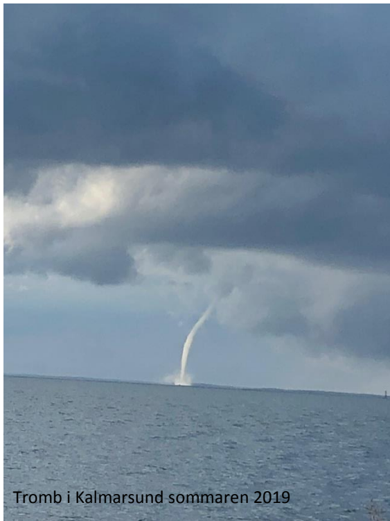
Tromb i Kalmarsund sommaren 2019