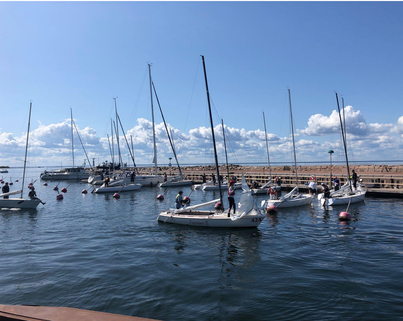
Bild från SM 606

OBS! Ändringar i programmet med anledning av corona-pandemin!