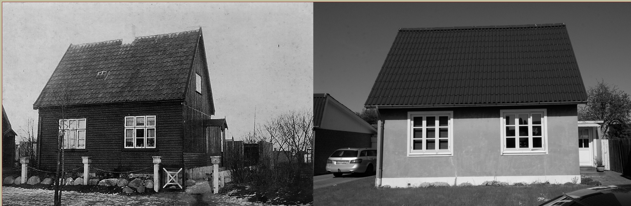
TRÆHUS , ROESSKOVSVej 83, BYGGET I 1925 , HER SET TIL VENSTRE FRA OMKRING 1930 OG TIL HØJRE FRA 2016.