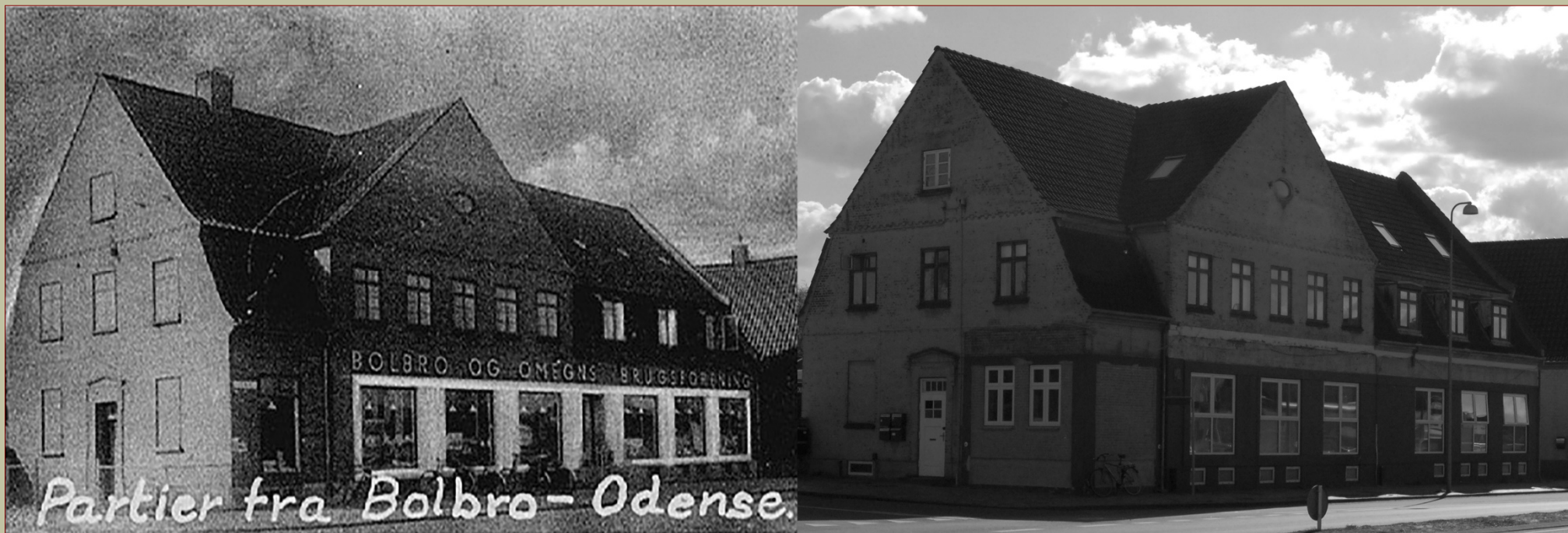
BOLBRO OG OMEGNS BRUGSFORENING PÅ HJØRNET AF MIDDELFART LANDEVEJ OG LUNDSGÅRDSVEJ., BYGGET I 1915, HER SET TIL VENSTRE FRA OMKRING 1930 OG TIL HØJRE FRA 2016. MIDDELFART LANDEVEJ BLEV DEN 20.9.1937 ÆNDRET TIL MIDDELFARTVEJ.