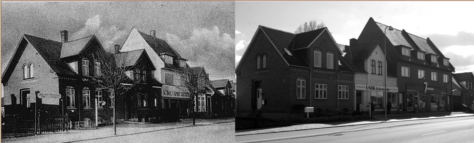
MIDDELFART LANDEVEJ 110 , 112, 114 OG 116, BYGGET I 1920 , HER SET TIL VENSTRE FRA OMKRING 1925 OG TIL HØJRE FRA 2016. MIDDELFART LANDEVEJ BLEV DEN 20.9.1937 ÆNDRET TIL MIDDELFARTVEJ.