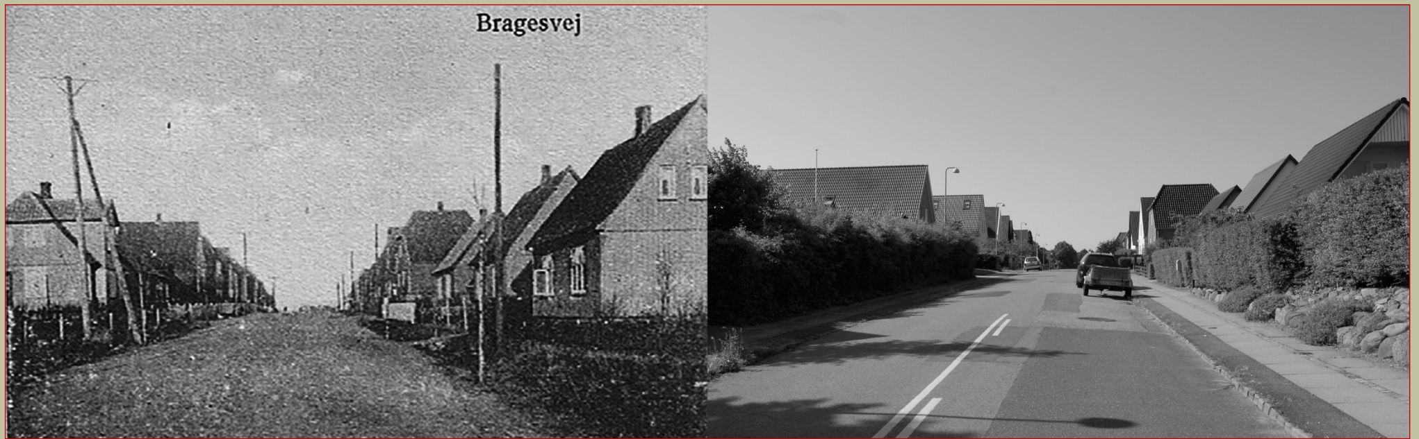
BRAGESVEJ med Træhuse, bygget fra 1925 og fremefter. HER SET TIL VENSTRE FRA OMKRING 1930 OG TIL HØJRE FRA 2016.