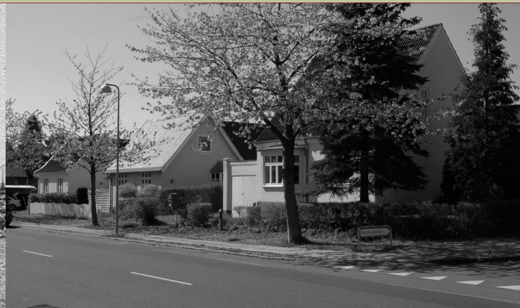
TRÆHUSENE PÅ ROESSKOVSVIJ HER NR. 99 PÅ HJØRNET AF BRAGESVEJ, BYGGET I 1925, HER SET TIL VENSTRE FRA OMKRING 1930 OG TIL HØJRE FRA 2016.