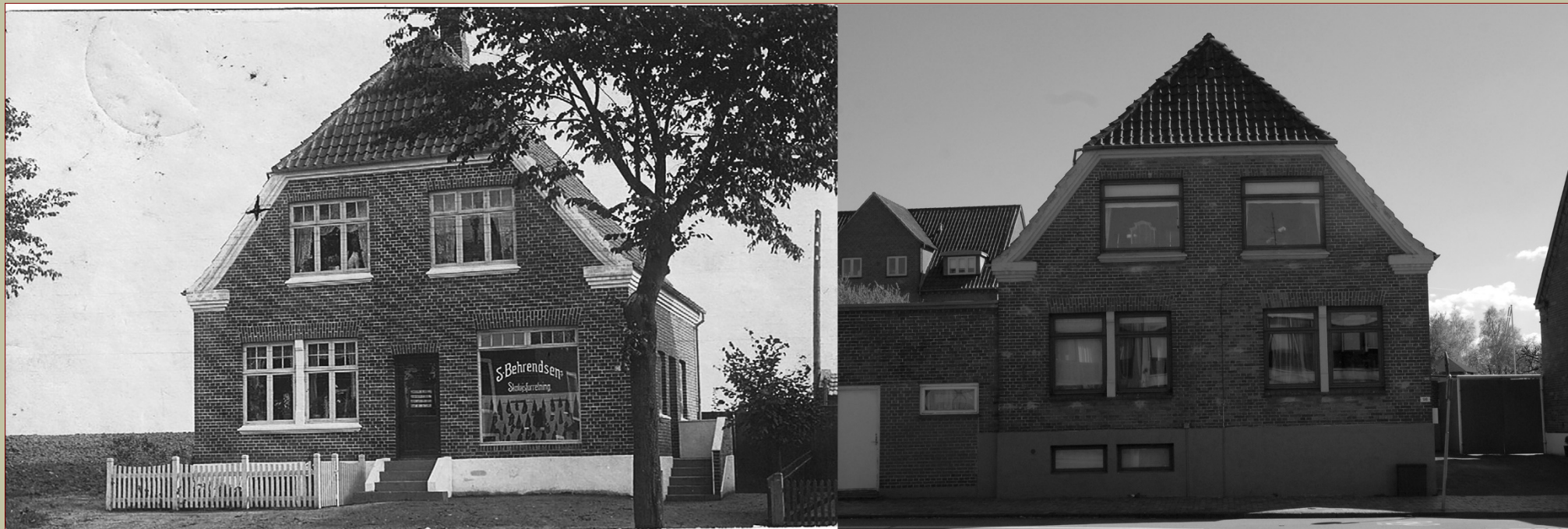
MIDDELFART LANDEVEJ 98, BYGGET I 1915, (BOLBROS FØRSTE POSTEKSPEDITION 1.2.1935—1939) HER SET TIL VENSTRE FRA OMKRING 1917 OG TIL HØJRE FRA 2016. MIDDELFART LANDEVEJ BLEV DEN 20.9.1937 ÆNDRET TIL MIDDELFARTVEJ.