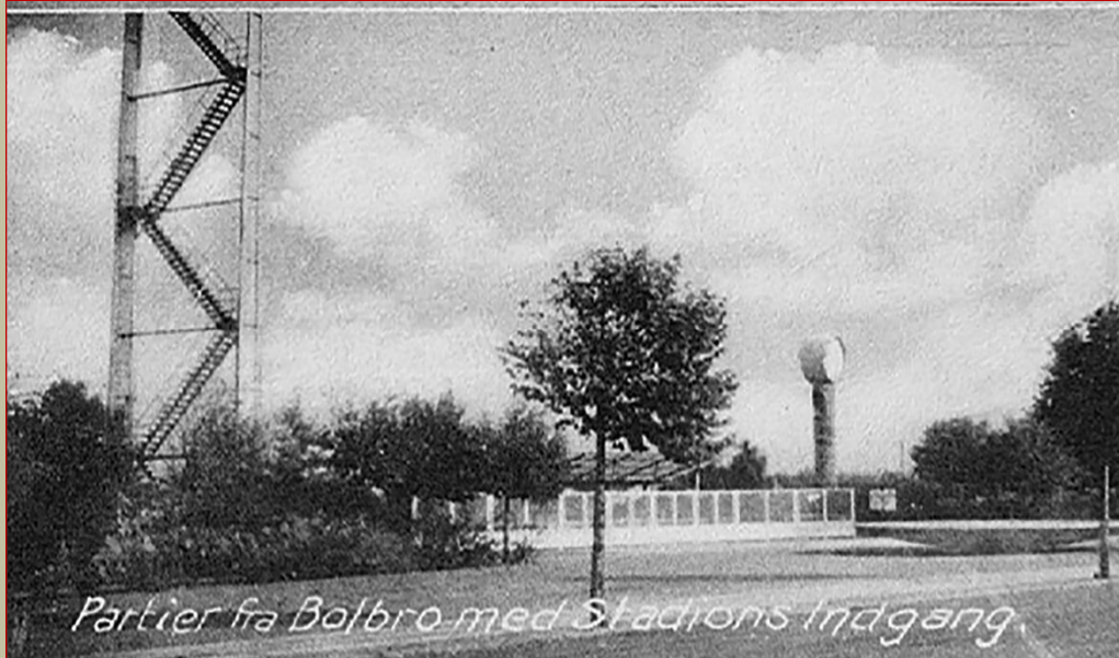
Partier fra Bolbro med Stations indgang.