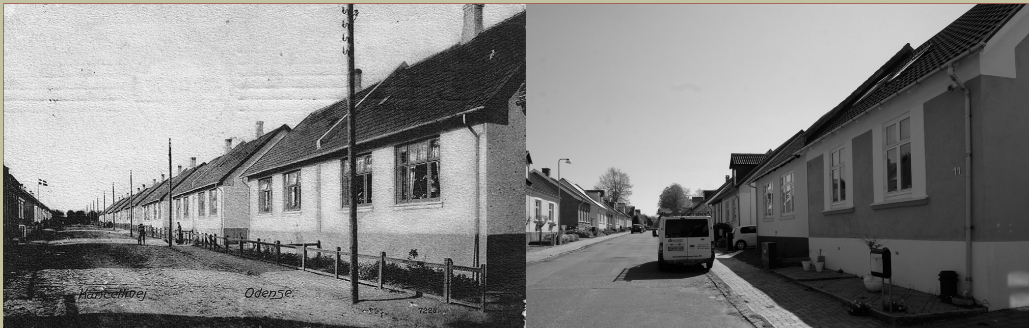
LOKOMOTIVHUSEN PÅ KANCELLIVEJ, BYGGET I 1908-1910, AF "BYGGESELSKABET AF ARBEJDERE VED SYDFYENSKE BANES MASKINVÆRKSTED" HER SET TIL VENSTRE FRA OMKRING 1915 OG TIL HØJRE FRA 2016.