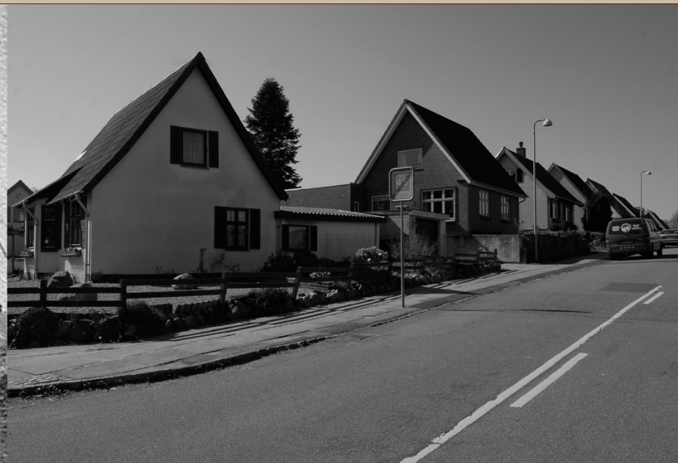
"TRÆHUSE" PÅ HØDERSVEJ, BYGGET I 1925-30 , HER SET TIL VENSTRE GADEN FRA OMKRING 1935 OG TIL HØJRE FRA 2016