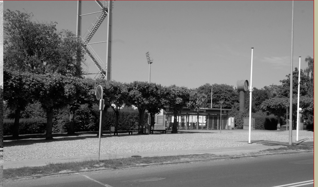
BOLBRO med Odense Stadion, indviet i 1941 HER SET TIL VENSTRE FRA OMKRING 1942 OG TIL HØJRE FRA 2016.