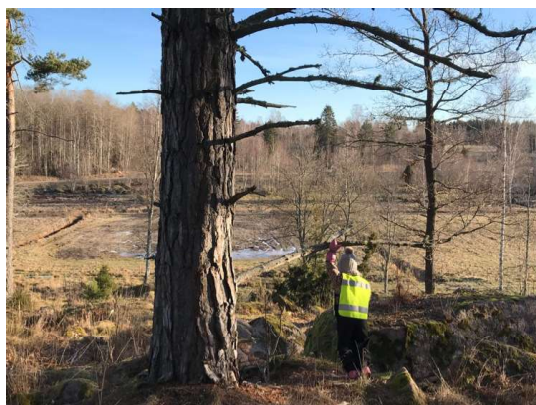
Bild från Bäckalyckans förskola