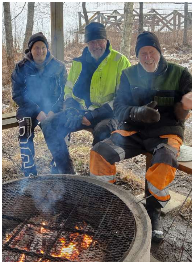
Ordningställande vid Klinten kräver lite grillning!