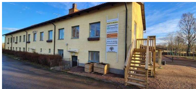
Boets skola

Kontakta Hasse Rydberg tfn 0705-120042 eller hasse@hasserydbergsalster.se