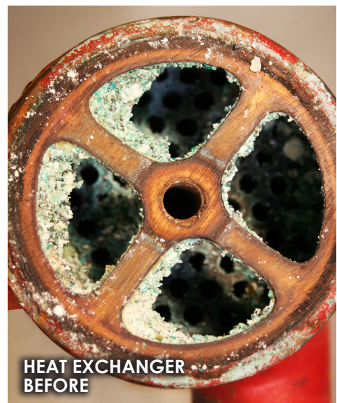
HEAT EXCHANGER BEFORE

Bruk RYDLYME Marine på fritidsbåter, for eksem- pel cabin cruisere, hurtigbåter, yachter, seilbåter, vannscootere og mer!