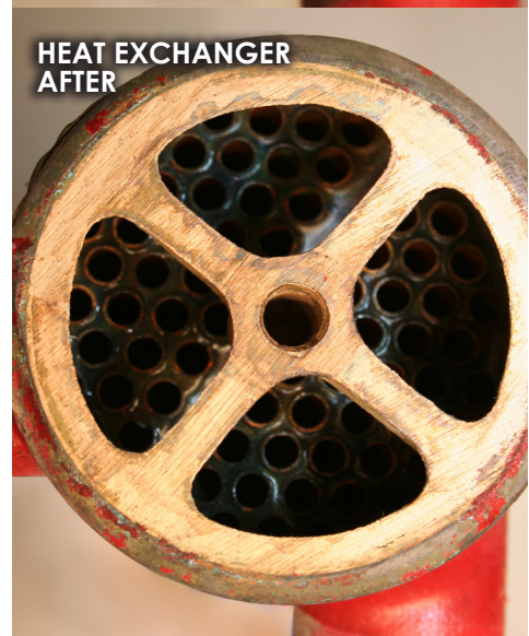
HEAT EXCHANGER AFTER