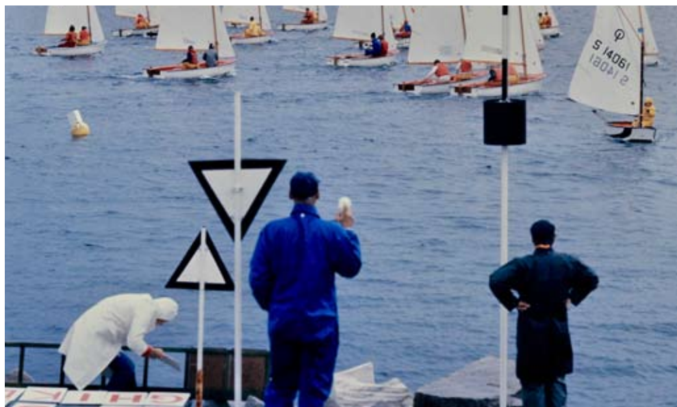
Startskottet har gått. Ingen tjuvstartade.