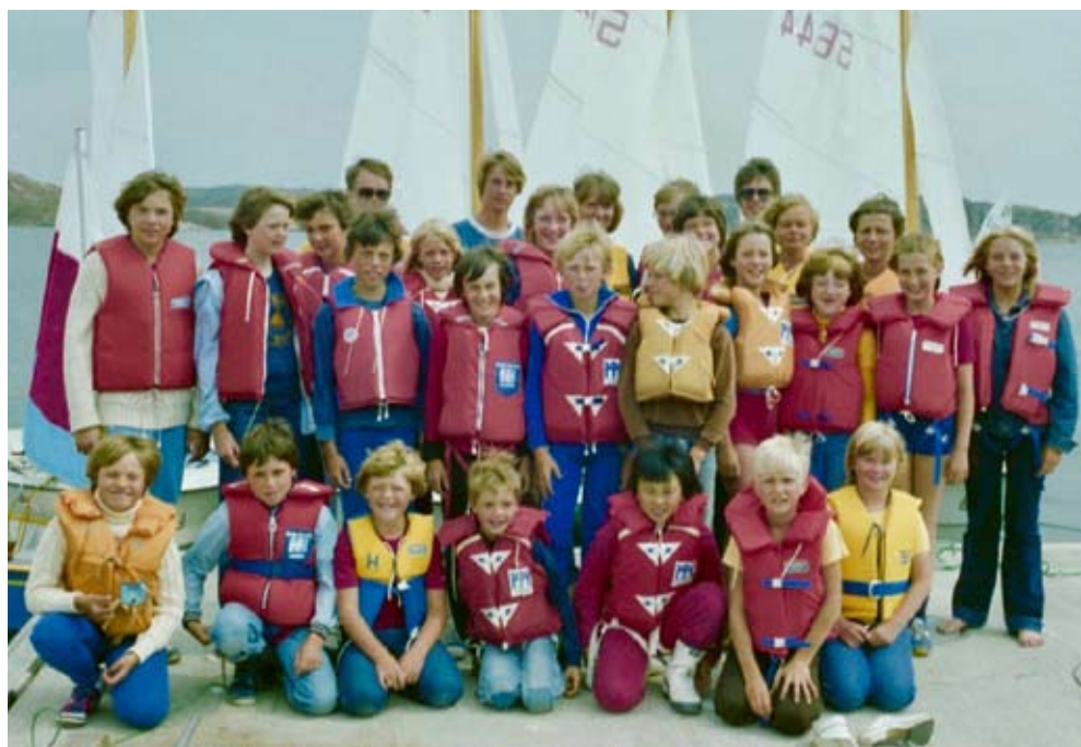
Avslutning i första seglarskolan med egna lärare sommaren 1975.