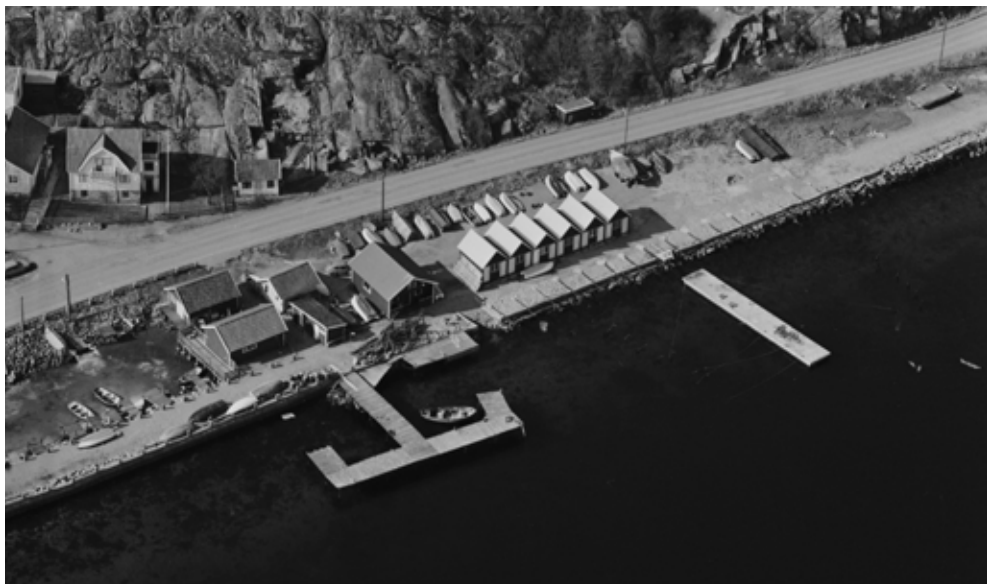
Skanshus sjöbodar och pontonbrygga och T-kungens brygga. Rälser för den nya bryggan är på plats.