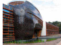
innovatie en duurzaamheid