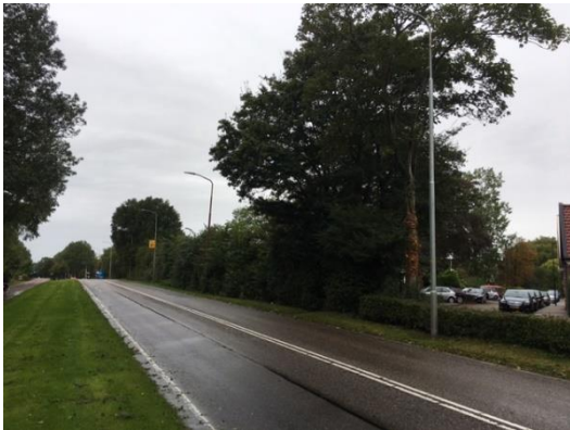
2. Hoogteverschil Zuiderweg t.h.v. de Laansloot

De voorgestelde plaats voor deze ontsluiting is een onveilige plaats omdat er zicht belemmerde omstandigheden aanwezig zijn. Dit zijn: Hoogteverschil tussen de ontsluiting en het verdere verloop van de Zuiderweg richting het westen en de knik in de Zuiderweg aan de westzijde van de ontsluiting. Als gevolg hiervan is dit voor alle weggebruikers een onoverzichtelijke situatie en hiermee een onveilige ontsluiting (afbeelding 2 en 3). Daarbij creëert deze ontsluiting ook dat men deze gaat gebruiken als oversteeklocatie. Hier heb ik eerder een zienswijze over ingediend (Plan ID NL.IMRO.0441.BPWGSZUIDERWEG4-on01). Nu betreft dit een andere situatie dan voorgenoemd plan maar nu al neemt men de kortste route tussen de bosjes/bomen door om zo de Zuiderweg over te steken van en naar de Dorpen. Dit zal met deze ontsluiting en dik 120 woningen voor de deur alleen maar toenemen, immers hoeft je daar ter plaatste niet meer door het gras heen.