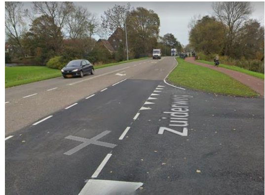
3. Knik in de Zuiderweg t.h.v. Laansloot

Door het "uitbuigen" van de weg zal men deels over de wegmarkeringen heen rijden wanneer de weg een beetje afgestoken wordt wat geluidsoverlast tot gevolg heeft. Ook vrachtwagens zullen een vloeiende lijn rijden en dus de wegmarkeringen deels mee pakken.