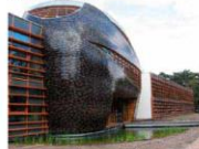
innovatie en duurzaamheid