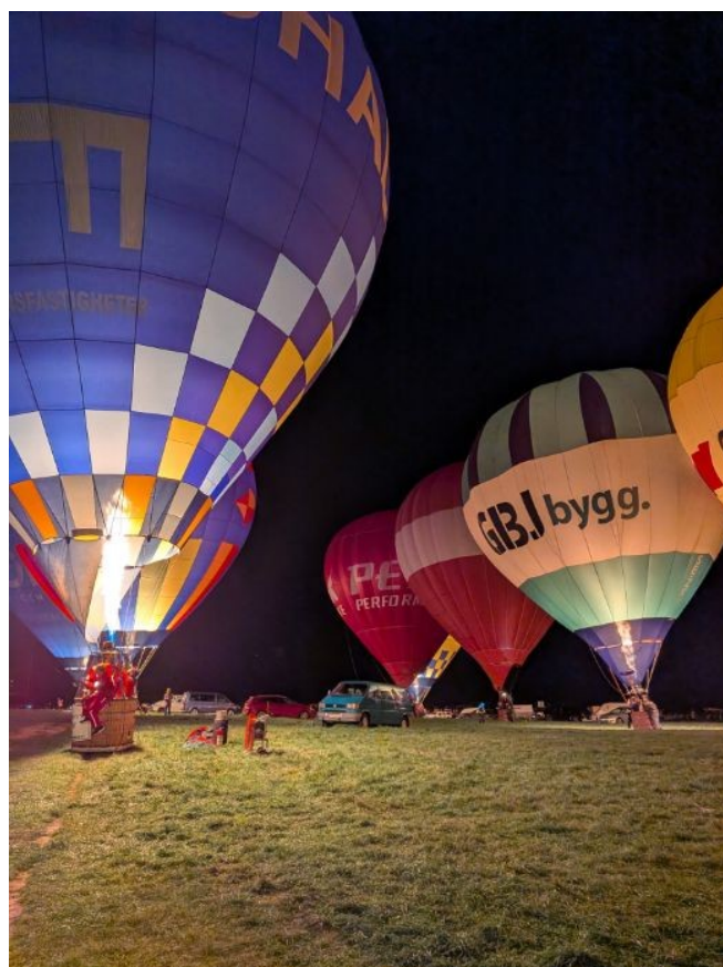
Kvällsaktivitet med upplysta ballonger

Tipspromenad med fika arrangerades 2 november. 29-30 november deltog flera medlemmar i instruktörskonferens i Skövde tillsammans med andra flygdiscipliner.