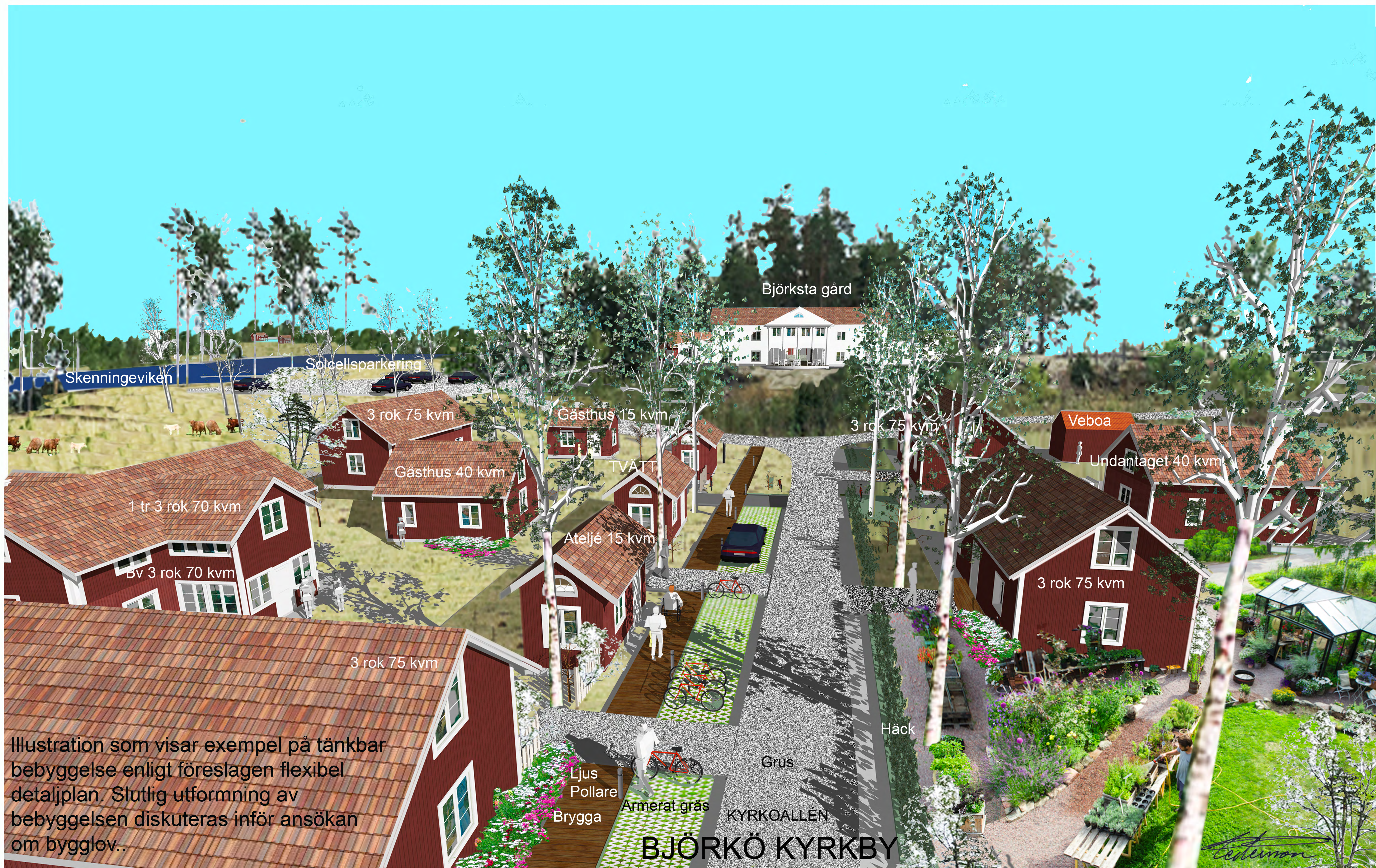
Illustration som visar exempel på tänkbar bebyggelse enligt föreslagen flexibel detaljplan. Slutlig utformning av bebyggelsen diskuteras inför ansökan om bygglov.

Kyrkoallén i riktning söderut mot Björksta Gård som siktar på klockstapeln i norr. Detaljplanen illustreras här med 6 st 3 rok kring 4 små ombonade gårdar. Tomtgränser behövs inte vid kooperativ hyresrätt. Det ger frihet att placera hus och att bilda gårdar enligt de boendes önskemål.