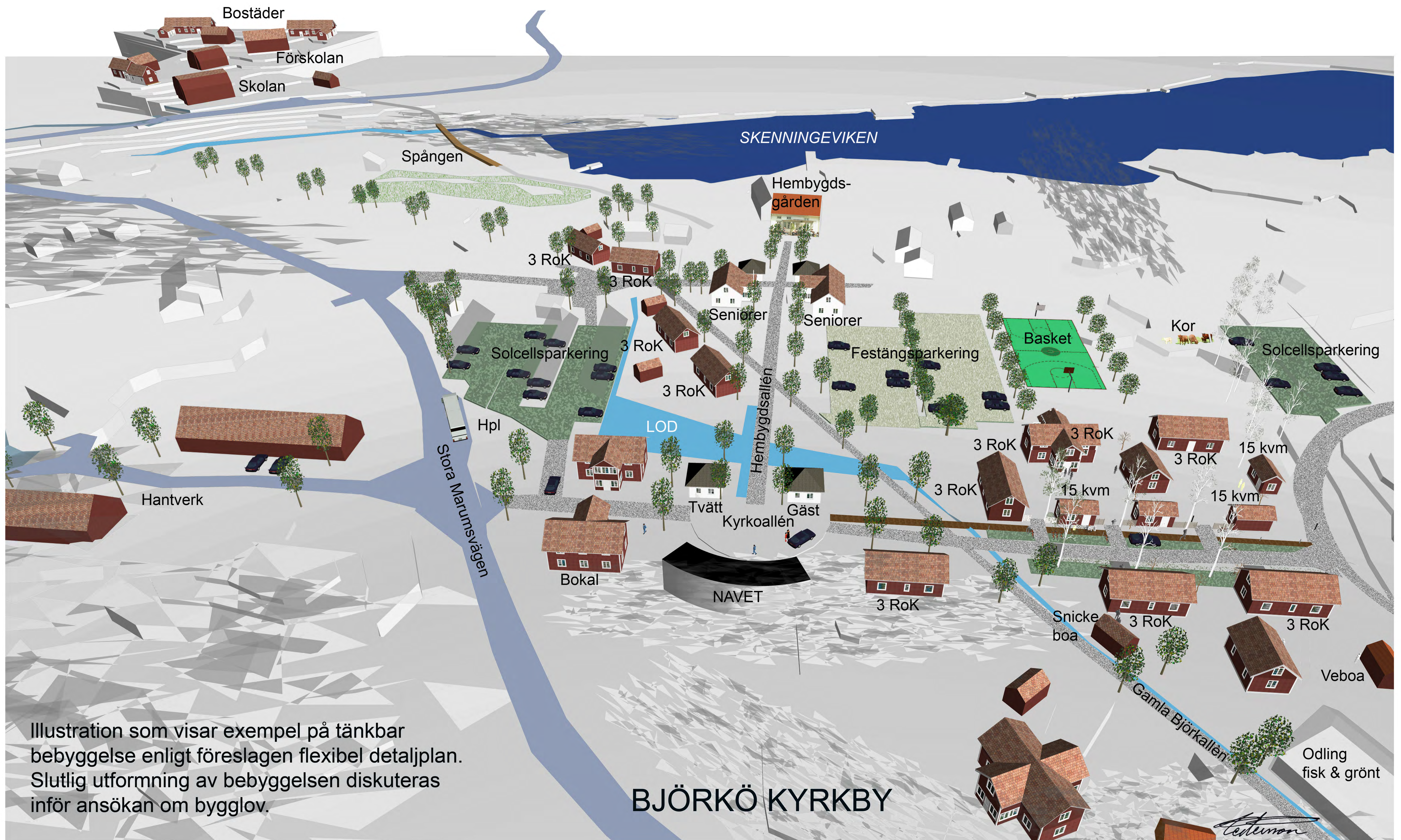
Illustration som visar exempel på tänkbar bebyggelse enligt föreslagen flexibel detaljplan. Slutlig utformning av bebyggelsen diskuteras inför ansökan om bygglov.