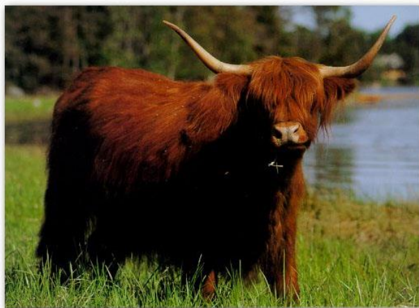
Fig.5. Highland ko som glatt betar på en strandäng

Highland cattle korna har blivit allt populärare i vårt land som "naturvårdare" eller "landskapsvårdare". De stängs in på gamla betesområden som växt igen, strand ängar och igenväxt gammal kulturmark för att hålla landskapet öppet. De är en ypperlig ras för detta, eftersom de gillar att lufsa runt i skog och mark och äta sly och buskar. Strandbeten tycker de speciellt mycket om, då de gillar att stå i strandkanten med vatten upp till magen och svalka sig en varm