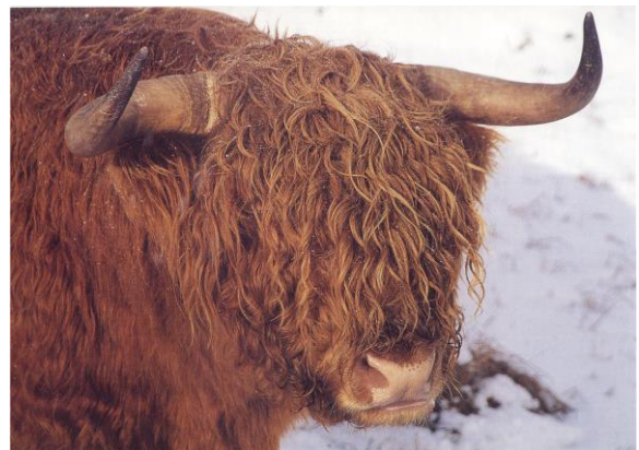
Fig.2. Highland cattle tjur med de karaktäristiska tjurhornen och lång lockig pannlugg.

Highland cattle har det största och mest iögonfallande huvudet av alla brittiska nötkreatur. I rasstandarden står det att det är viktigt att huvudet står i bra proportion till kroppen, vilket gör att tjurarna har grövre och "tyngre" huvud än korna. Det ska vara brett mellan ögonen, medan avståndet mellan ögonen och mulen skall vara kort och bilda en "triangel". Pannluggen skall vara bred och lång med början över hela hornfästet och räcka ända ner till mulen och kinderna. Ögonen ska vara ljusa, klara och visa mod när djuret blir upphetsat. Ögonen omges av långa ögonfransar som ser till att hålla ögat rent från insekter och skräp. Nosen ska vara bred med stora utvidgade näsborrar. (The Highland... 2006:10 ; Highland cattle före...2001-2002)