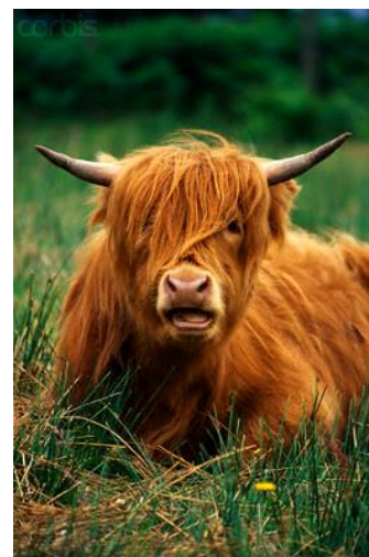
Fig.4. En Highland kviga som lungt ligger och idisslar intill flokken.

får gå med sina mödrar ända tills hon får en ny kalv, ett år senare, då hon själv stöter bort den gamla kalven. Tjurkalvarna däremot bör redan vid åtta månaders ålder avlägsnas från flokken och flyttas till en skild inhägnad, eftersom de redan då börjar vara könsmogna och kan göra en ko dräktig. Enligt gammal skotsk standard bör kvigorna inte betäckas förrän de är tre år gamla, viket är väldigt sent i jämförelse med våra andra koraser, men de kan istället kalva varje år ända upp till 20 års ålder (Händelser i Alsterbrobygderna 2006; Landsbygdens folk nr32/2002; Highland cattle före...2001-2002).