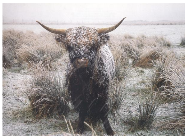
Fig.3. Om pälsen är i bra skick på en Highland cattle ko lämnar det ofta en "snömatta" som inte smälter utanpå pälsen.

Pälsen skall vara lång, vågig och tät, speciellt på de tidigare nämnda ställena som till exempel pannluggen och tjurens nackkam. Orsaken till att Highland cattle har utvecklat så lång och tjock päls är att de under många generationer har härdats av det kalla och karga klimatet som råder på det skotska högländet. Speciellt för rasen är att de har dubbelt tjockare läderhud jämfört med andra koraser, vilket ger ett extra skydd mot kyla. De har dessutom två pälskikt. Det yttre är långt