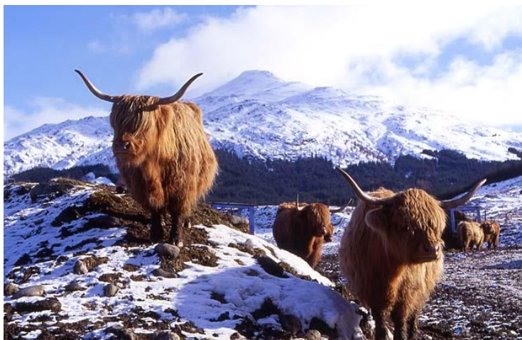
Fig.1. Highland cattle kor en solig vinterdag på det skotska högländet. Tack vara de stränga förhållandena har rasen blivit väldigt tålig och stark

På skottland var korna länge en mycket viktig del av de skotska böndernas liv. På mager fodertillgång och i hårt väder kunde korna föda en ny välmående kalv varje år. De producerade också så pass mycket mjölk att det både räckte till kalven och bondens egen familj. Blod tappades av de levande korna som tillskott till den magra maten och horn, hår och skinn togs väl tillvara vid slakten och användes till olika nyttosaker. Highland cattle korna var så värdefulla för människorna på skottland