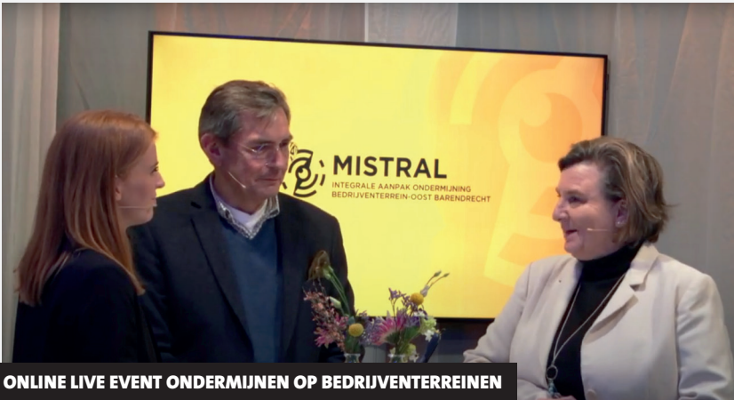
ONLINE LIVE EVENT ONDERMIJNEN OP BEDRIJVENTERREINEN