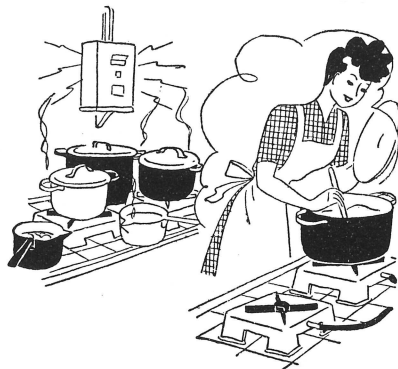
Alt i een Gryde.

Ærterne udblødes 2 Døgn i kogt, koldt Vand og koges i dette. Naar Ærterne er møre, passeres de eventuelt gennem en Sigte eller Kødmaskine og tilsættes Suppen, hvori de udskaarne Kartoffler, Gulerødder og Porrer samt en Visk er kogt. Lidt Timian kan koges med. Salt og Smør tilsættes. Det hele koges sammen et Øjeblik.