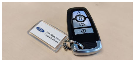
Selv nøglen har et fint design.