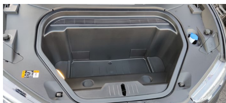
Frukt på ca. 80L blev der plads til.