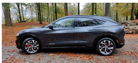
Mustang Mach E set fra siden.