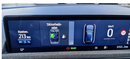
Instrumentbordet har de nødvendige funktioner, men jeg savnede et headup display i en bil til den pris.