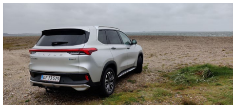
Der er faktisk en fin udsigt, selv om både bilen og vejret er gråt.

Ved opladning fra 20-80% på en 50kWh DC ladestander opnåede bilen at lade 47,5 kWh på en time. Svare til ca. 200 km. Test af strømspild på DC 50 kWh lader: 4,85%. Bilen lader kun på 1 fase hjemme: Ladetid ca. 19 timer. Du kan derfor ikke planlægge at lade billigt om natten hjemme, medmindre du kun kører ca. 80-100 km pr. dag, da dette kan oplades på ca. 6 timer.