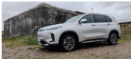
Euniq6 set i perspektiv foran en bunker nær Oddesund.