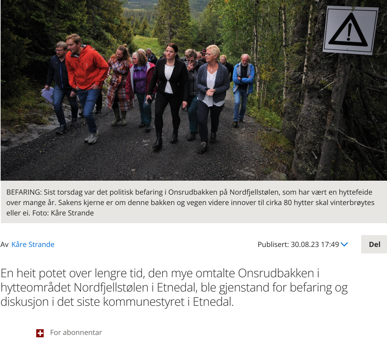
BEFARING: Sist torsdag var det politisk befaring i Onsrudbakken på Nordfjellstølen, som har vært en hyttefellede over mange år. Sakens kjerne er om denne bakken og vegen videre innover til cirka 80 hytter skal vinterbrøytes eller ei.