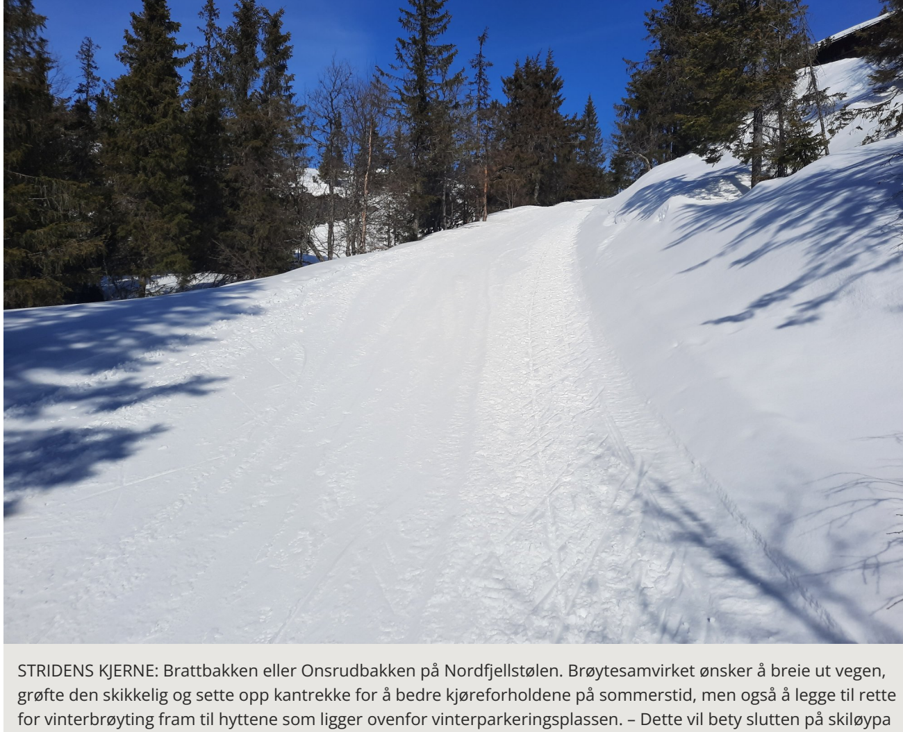
STRIDENS KJERNE: Brattbakken eller Onsrudbakken på Nordfjellstølen. Brøytesamvirket ønsker å breie ut vegen, grøfte den skikkelig og sette opp kantrekkje for å bedre kjøreforholdene på sommerstid, men også å legge til rette for vinterbrøyting fram til hyttene som ligger ovenfor vinterparkeringsplassen. – Dette vil bety slutten på skiløypa gjennom området, mener grunneier som er imot vinterbrøyting.