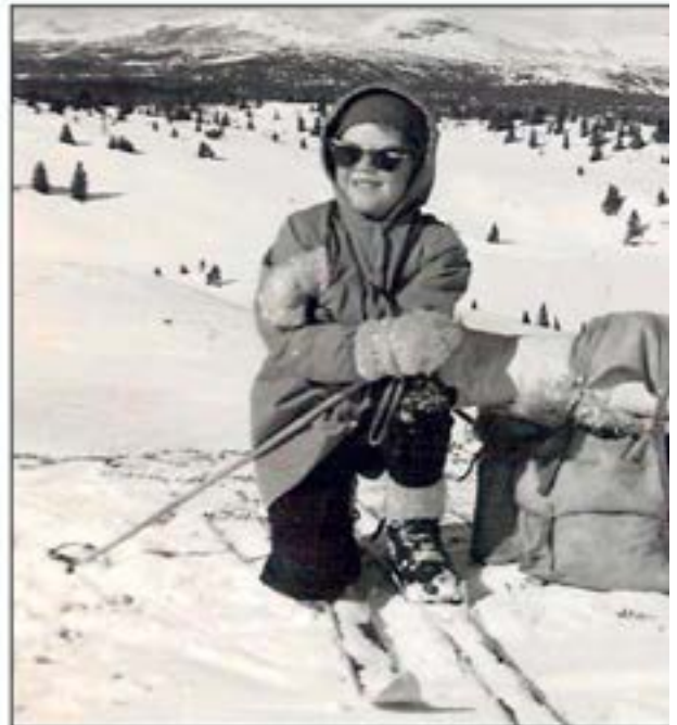
UNG OG LOVANDE: Skribenten med sju år gamle vesle skituren vår i snauffjellet. Bildet er frå vinteren 1961.

MEN BILEN gjorde det mogleg å koma til nye stader. På Kruk var det reindrifter stundom, og dét var spennande å sjå. Eg kan hugse at vi parkerte bilen på Kruktjednet, der det var brøyta plass. Men stundom laut vi parkere i vegkanten òg. Vi gjekk neppe heilt til topps på Smørlif-