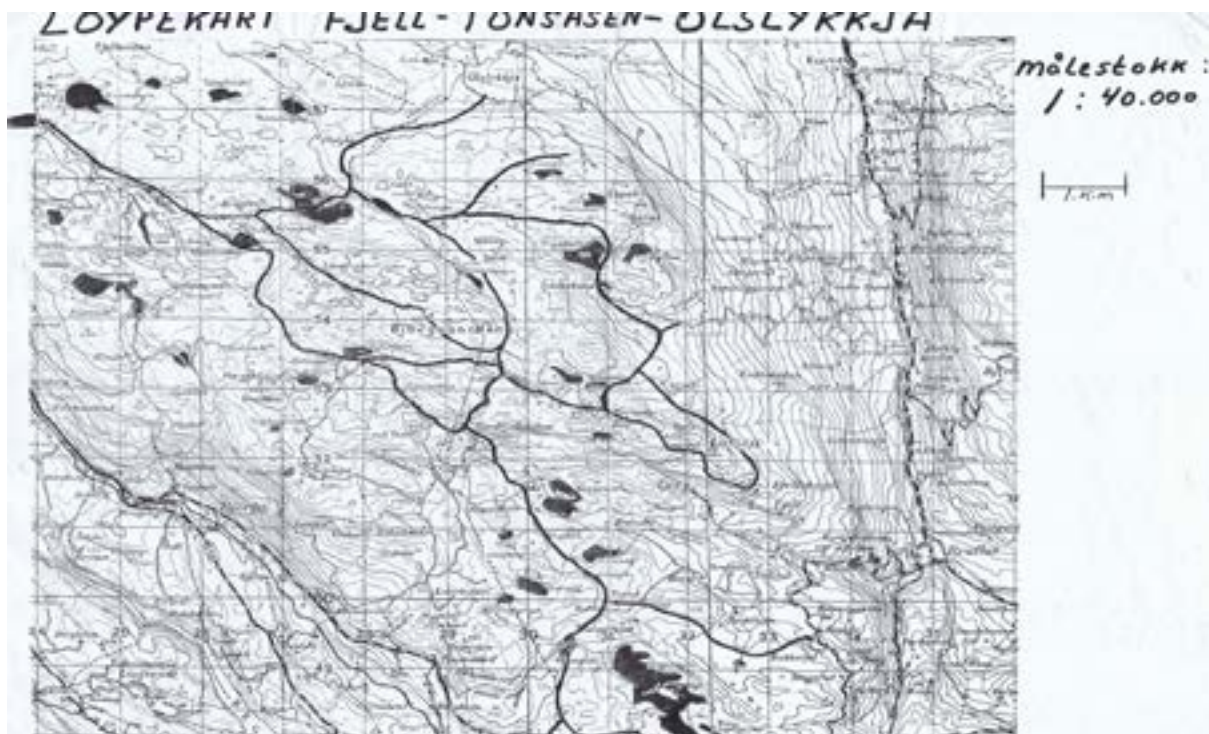
Kart fra KOMMUNEDELPLAN FOR FRILUFTSLIV 2002

Fra slutten av 1990 tallet kom det istand kommunalt organiserte løypelag som samordnet løypekjøringen mellom de ulike områdene.