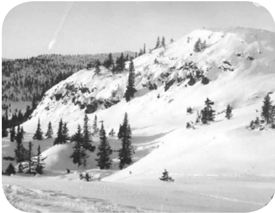
Skiløyper over myra ca 1912 i omtrent samme trase som veien/løypa går i dag-Fjellkinna i bakgrunnen.