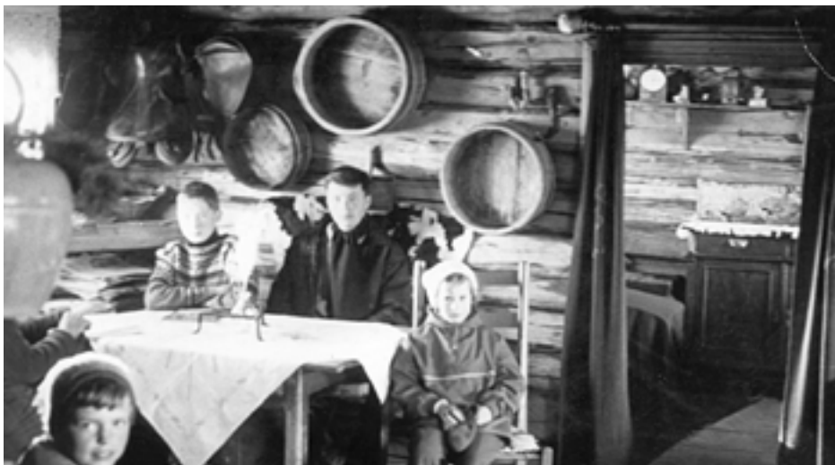
Skikafe på 1960-tallet