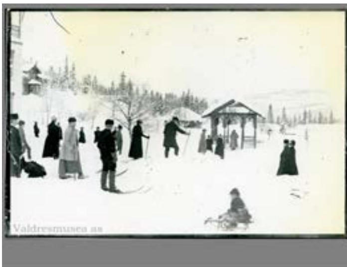
Fra Tonsåsen Sanatorium.

På 1980-tallet solgte Oslo Trygdeforening Tonsåsen Sanatorium [8]