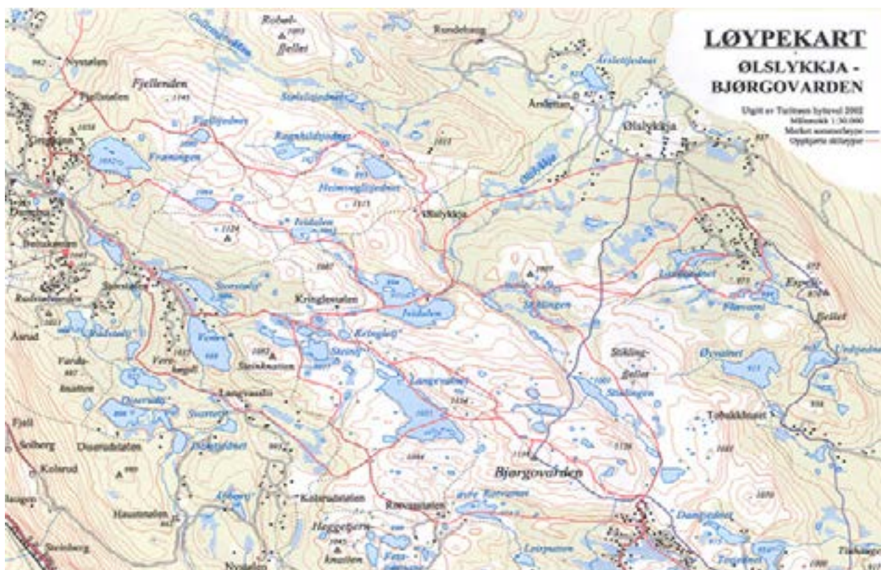
Skiløypekart utgitt av Turitrøen hyttevev i 2002