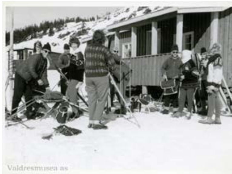
Skiturister på Nordfjellstølen ca 1960 tallet. Den ombygde Tonsås hytta i bakgrunnen