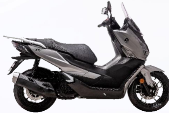
Gris plata titanio