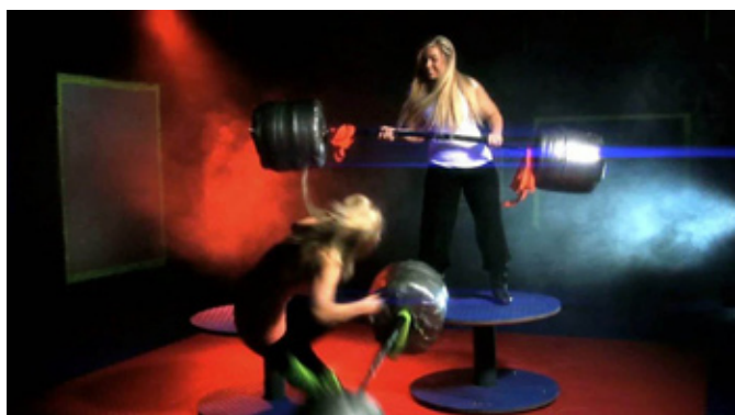
Gladiatorkamp kan få latteren fram både hos deltakere og publikum.

Fredag kveld blir etter ønske fra mange en frikveld, en kveld der man får tid til den gode praten – både for de som har deltatt på fagdagen og de som ankommer for å være med på kulturdagene. For ungdom under 18 år er det åpent hus i døveforeningens lokaler i Klostergata, der pizza står på menyen.