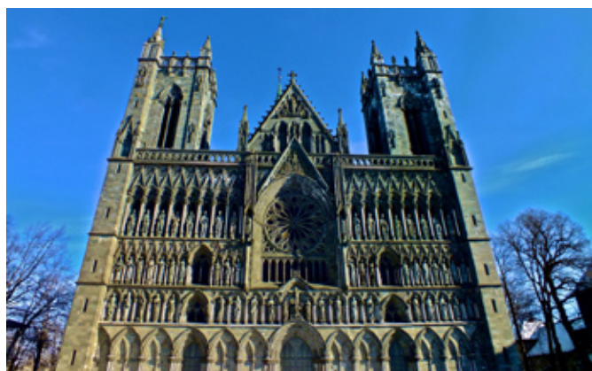
Nidarosdomen er Norges eneste katedral og inviterer døve til gudstjeneste søndag.