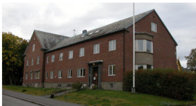
I Klostergata er døveforeningens lokaler med ungdomsfest både lørdag og søndag.