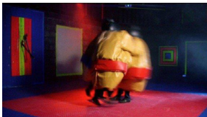
Sumobryting kan by på uventede fall.

Nidarosdomen er Norges mest sentrale kirke, fordi den er Olav den helliges gravkirke. Den betraktes som Norges nasjonalhel-