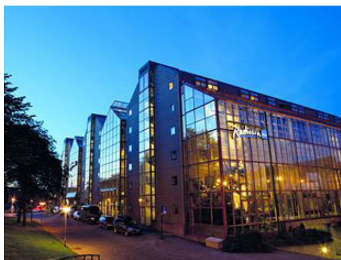
Royal Garden hotell har et gunstig tilbud for overnatting under kulturdagene.

Se www.kulturdagene.net for mer informasjon, pris og påmelding til en spennende Fagdag.