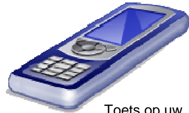
Toets op uw

Wisten jullie dit al? Informatie die zeer nuttig is en waarbij men zich kan afvragen waarom deverkopers dat niet zeggen!