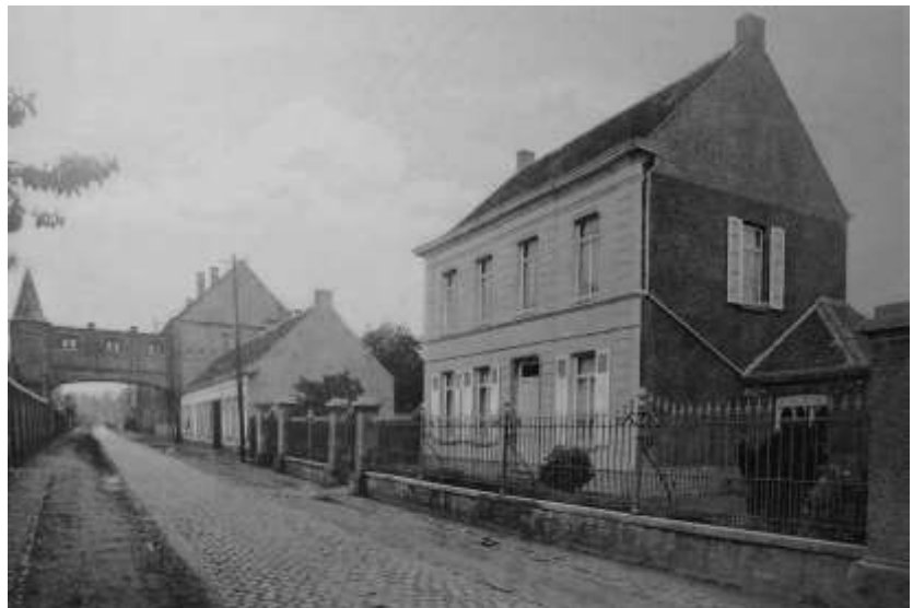
Woning directeur en brug tussen internaat en school

In 1986 werd de kostschool gesloten bij gebrek aan leerlingen en de drie overgebleven zusters keerden terug naar hun congregatie in Gent.