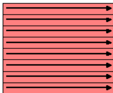
Progressive Scan (Non-interlaced)