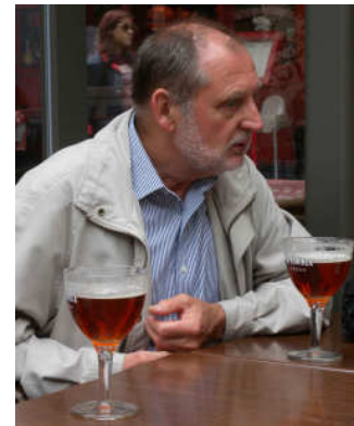
Voor mij 2 bollekes, één links en één rechts

(*) Nog steeds te raadplegen, o.a. door te Googelen op "Jeroen Meus bij de Chassidische Joden van Antwerpen"